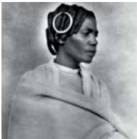
Imagen Casa África

Treinta y tres fotografías restauradas, tomadas a principios del siglo XX en Madagascar, que muestran escenas de la vida cotidiana de esa época en ese país, componen la exposición que se exhibirá desde mañana en Casa África hasta el próximo día 30 de diciembre.