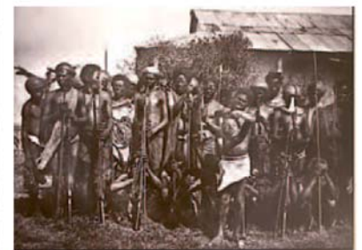
Tres de las fotografías que se incluyen en la exposición 'Madagascar 1906', en Casa África. | QUIQUE CURBELO