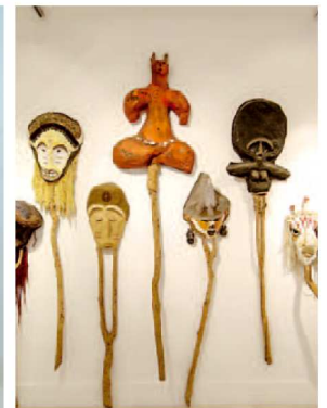
A la izquierda, serie 'Tragedias atlánticas' de 2000. En el centro, 'tótem'. Sobre estas líneas, máscaras. | A. CRUZ