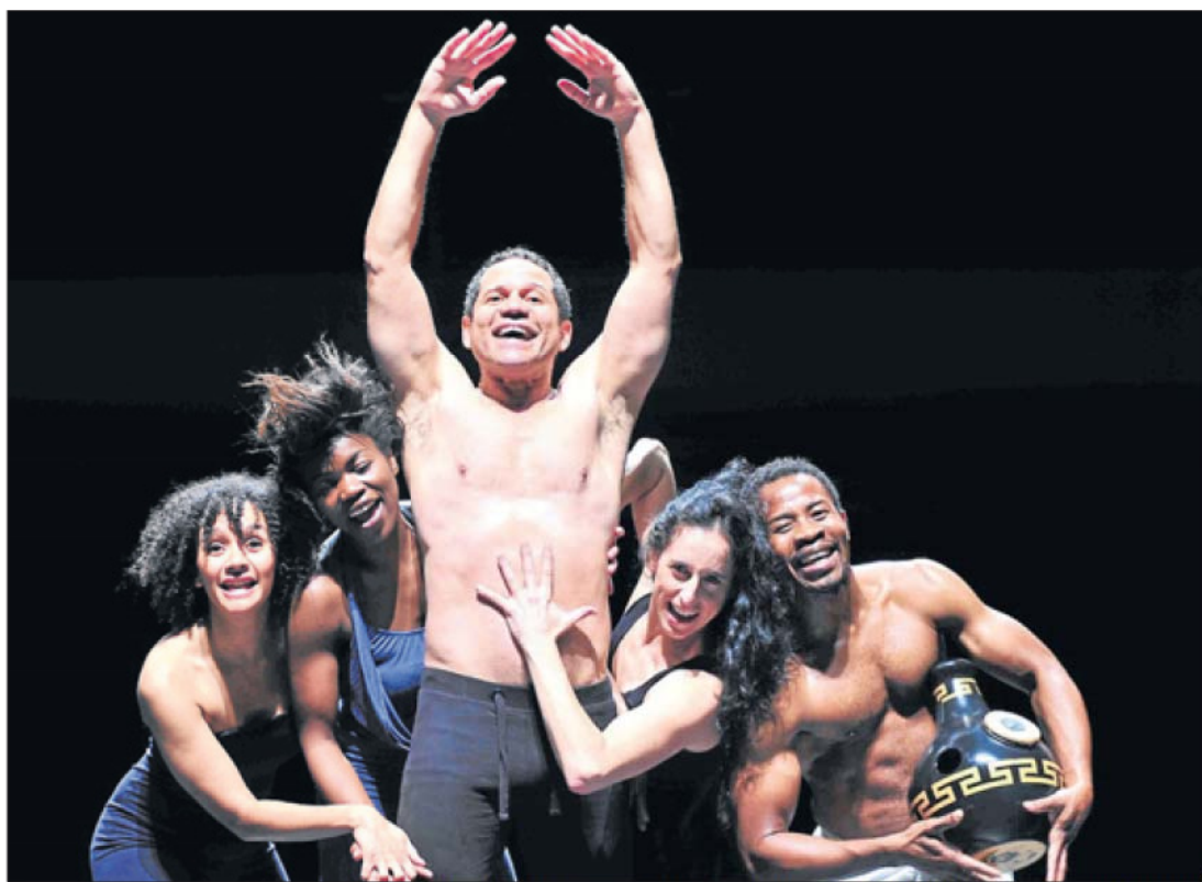
Erotismo global. Imagen de la obra Decamerón Negro , un recorrido por las artes de la seducción con actores de Malí, Burkina Faso, Guinea Ecuatorial y España.

El ingrediente africano lo pondrán el bailarín Auguste Quédrago, los caboverdianos de