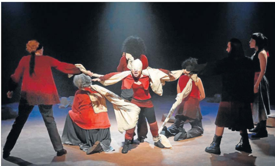
Obra. Imagen promocional de la pieza Misericordia , que protagoniza la Compañía Nacional de Teatro de México.