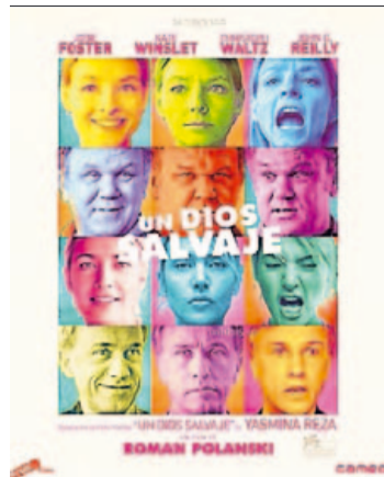
'Un dios salvaje', de R. Polanski. | LP