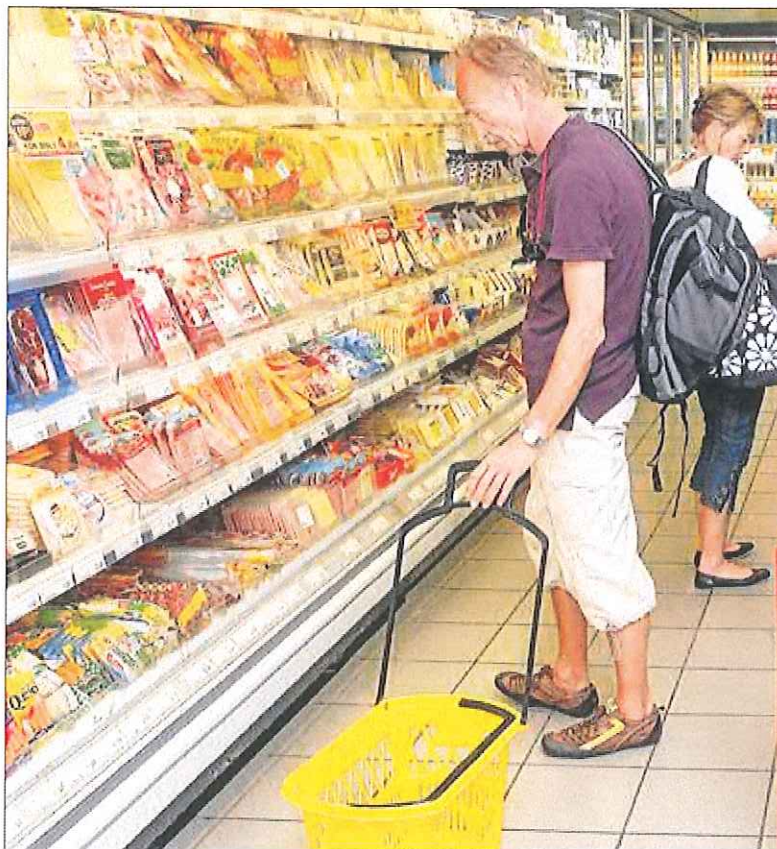
Visitantes. Imagen de archivo de un turista comprando en un supermercado del sur de Gran Canaria.

Se escogieron 25 establecimientos en San Bartolomé de Tirajana, 16 en Mogán, y el resto, en municipios con poblaciones superiores a los 15.000 habitantes: de Las Palmas de Gran Canaria, Agüimes, Arucas, Gáldar, Ingenio, Santa Brígida, Santa Lucía y Telde.