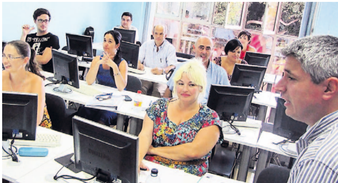
Una clase en Formación Profesional Guayre.

Y respecto a la representación aduanera, actualmente nos enfrentamos a la modificación del