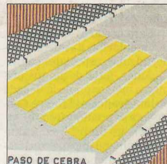
PASO DE CEBRA

de la Universidad de La Laguna a muchos matrimonios que acceden con sus hijos y cochecitos de bebé a la farmacia. Es un ruego, a nivel de clamor de los ciudadanos. Ya próximo a la Cabalgata de Reyes Magos, no vendría mal, como obsequio de Reyes para los más de 100.000 personas que acudirán al barrio de Triana el día 5 de enero de 2013, vispera de Reyes. Juan Jiménez Martín. Las Palmas de Gran Canaria