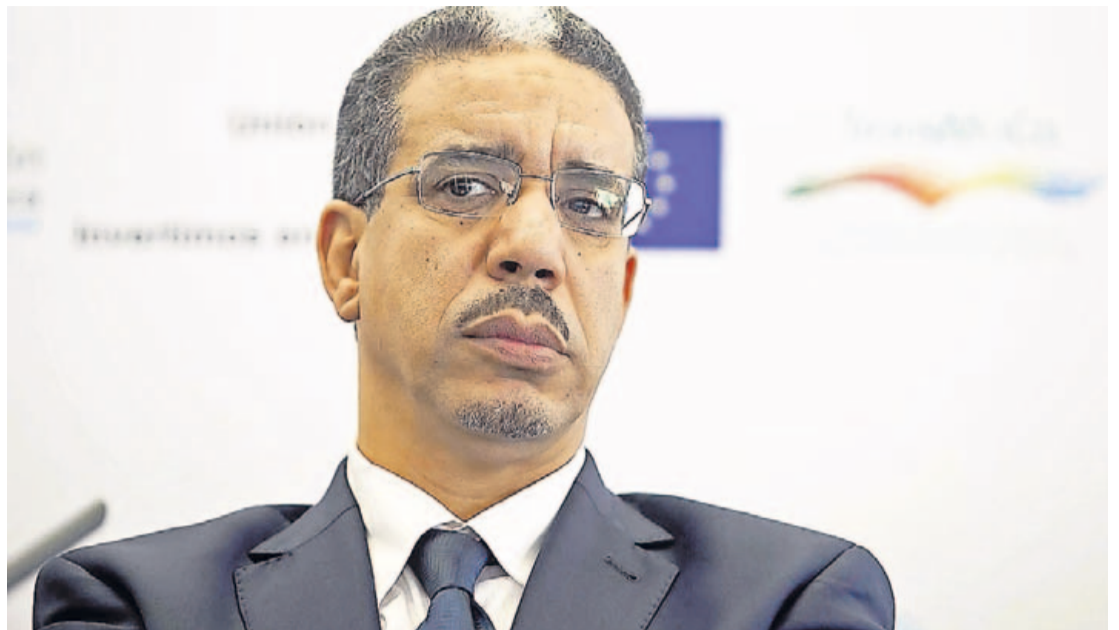
El ministro de transportes de Marruecos, Abdelaziz Rabbah

Se pretende consolidar un espacio de discusión e intercambio institucional y empre-