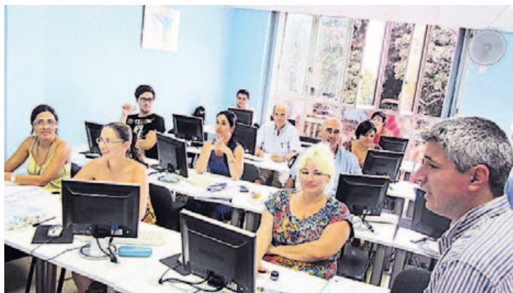
Aula del centro del centro de FP Guayre, en la calle Gordillo, nº13.

Todas éstas y más exigencias son resueltas por FP Guayre a través de la formación de demanda, que es la que proporcionan las empresas a sus trabajadores según sus necesidades para el desarrollo de las actividades. Esta modalidad de formación permite que dichas empresas recuperen, total o parcialmente sus inversiones en los cursos realizados por sus