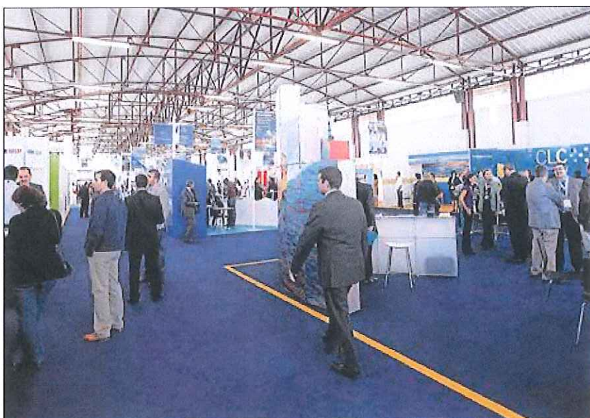
Negocios. Imagen de la segunda edición de la feria de negocios que se celebró el año pasado en Gran Canaria.

Los participantes contarán con más de 10.000 metros cuadrados de espacio expositivo para realizar contactos profesionales y asistir a actividades paralelas.