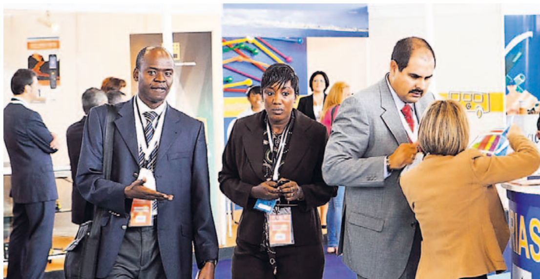
Imagen del Salón Atlántico de Logística y Transporte del año pasado.