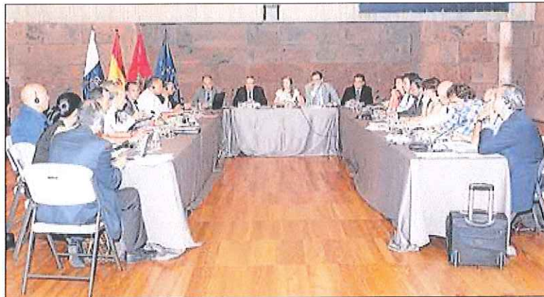
Preparación. Reunión preparatoria del SALT 2012 entre miembros de las delegaciones marroquí y canaria.

En lo que a conectividad aérea se refiere, las ponencias se centrarán en el desarrollo de los aeropuertos y las conexiones aé-