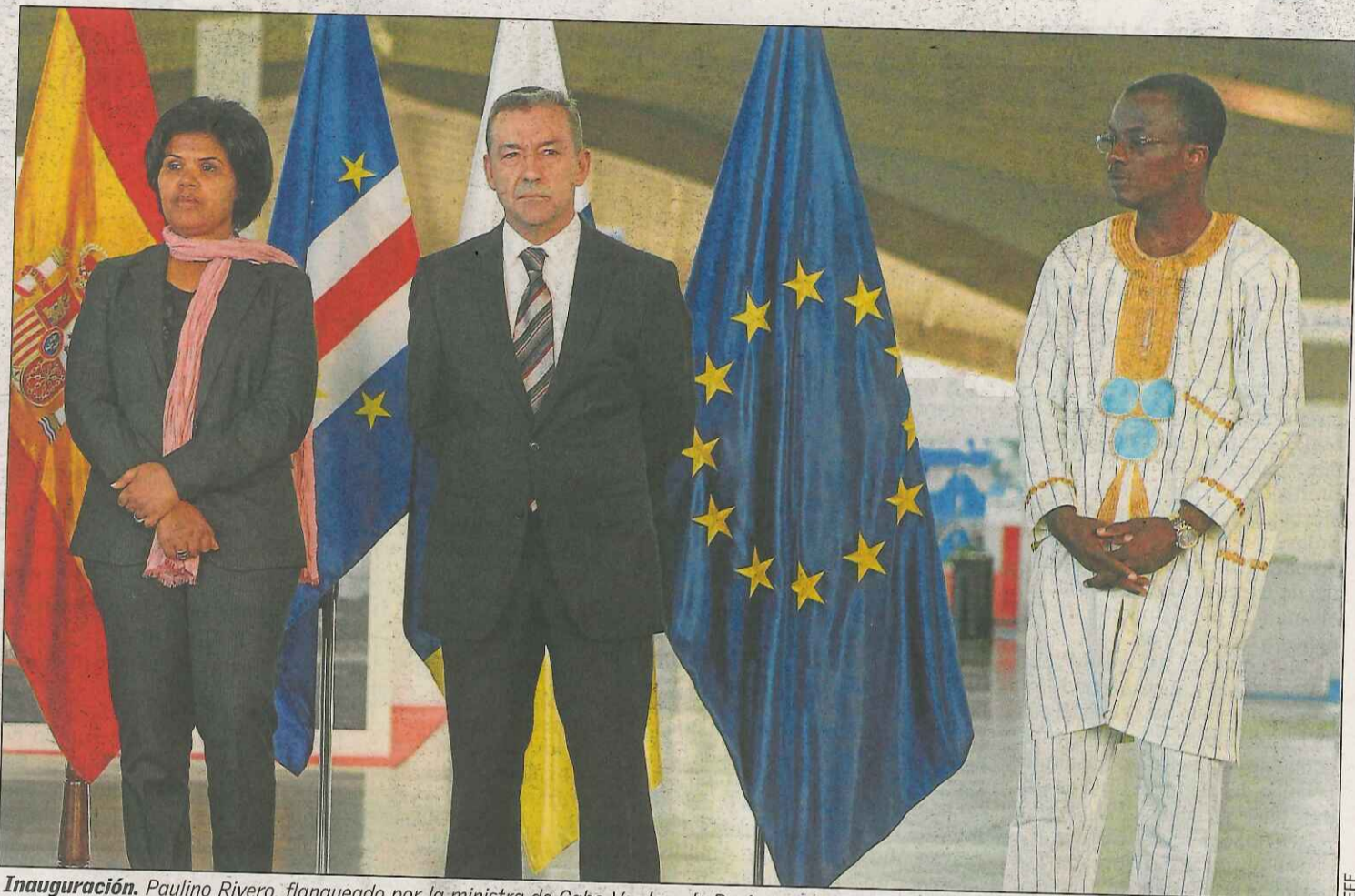
Inauguración. Paulino Rivero, flanqueado por la ministra de Cabo Verde y de Benin.

El Salt ha mantenido su vigor en estas tres últimas ediciones. Por un lado, se decidió continuar con la actividad, pese a que los organizadores planificaron dejar dos años de vacío para evitar «agotamientos» en la comercialización del producto. Sin embargo, se propuso que Tenerife continuara como sede.