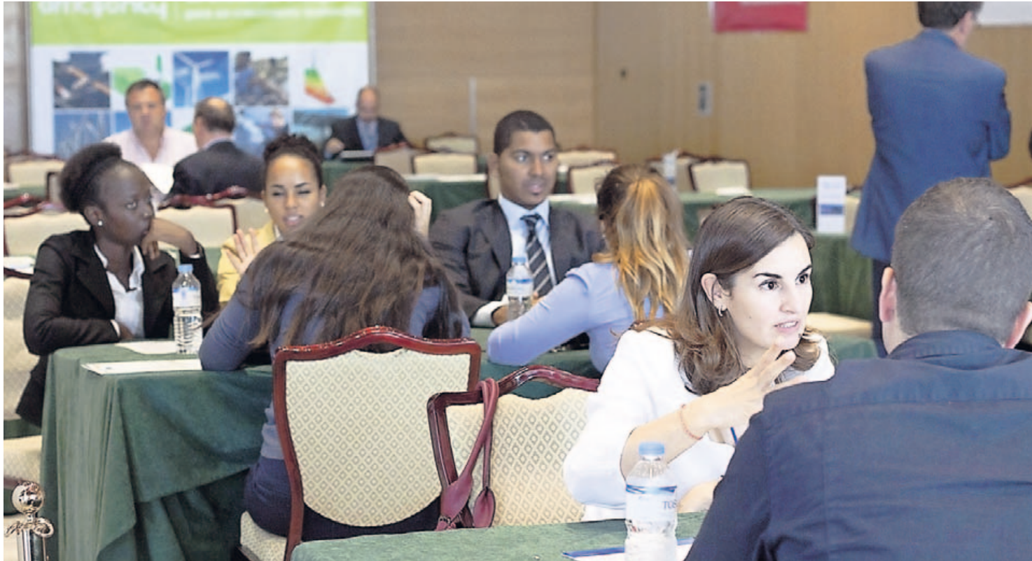
Mesas de trabajo en Africagua, en las que representantes de estados africanos coinciden con técnicos, empresarios o inversores. | GABRIEL FUSELLI