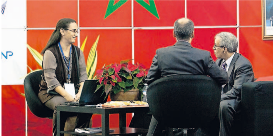
Reunión de trabajo en el contexto de SALT 2012.

A esto se suma el hecho de la experiencia que muchas entidades de las Islas tienen ya en negocios con Marruecos, a lo que se suman otras ventajas, como la proximidad del país, su estabilidad política, las numerosas conexiones y las favorables expectativas de crecimiento del Reino alauí, con una tasa de crecimiento económico en torno al 4,5% para es-