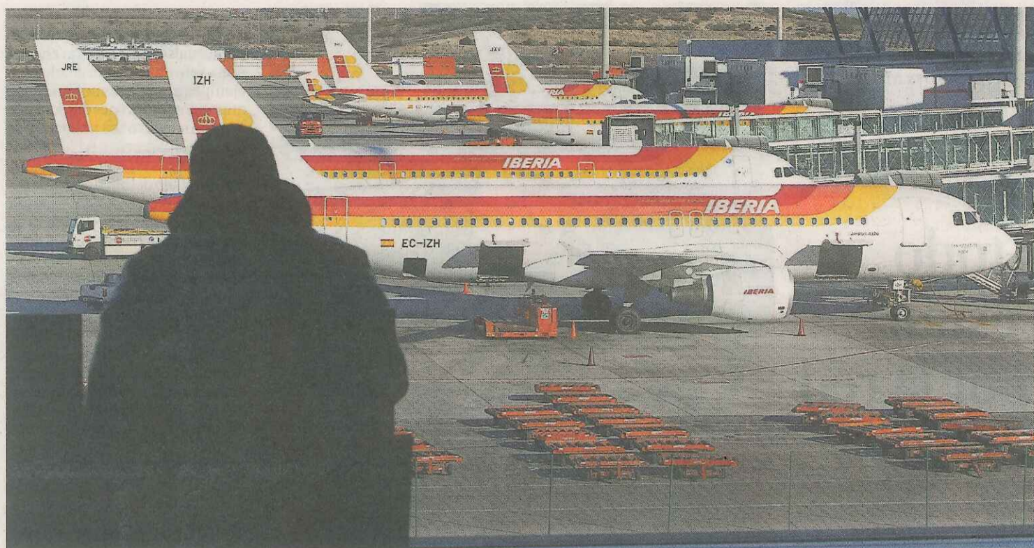
Aviones de Iberia estacionados en la Terminal 4 del aeropuerto de Barajas durante una pasada jornada de huelga.