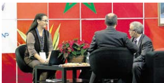
Reunión de trabajo en el contexto de SALT 2012 LOT

LAOPINION.ES Dentro del bloque de cooperación empresarial del Salón Atlántico de Logística y Transporte, la Dirección General de Relaciones con África del Gobierno de Canarias y Casa África han impulsado una iniciativa para que el empresariado canario conozca de primera mano la oferta de licitación pública marroquí, abriendo la puerta a una nueva vía de negocio para las empresas canarias en un momento especialmente complicado en el que muchas se ven obligadas a diversificar su negocio.