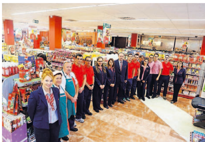
Imagen de empleados de la nueva tienda de SPAR en Tomás Miller.

que oferta en las secciones de productos frescos, ya sea charcutería, carnicería, frutería o pescadería. El nuevo SPAR dará trabajo a 25 empleados, que atenderán al público de lunes a sábado de 08.30 a 21.00 horas, exceptuando la sección de comidas preparadas, pastelería y panadería, que también abrirá sus puertas los domingos de 09.00 a 15.00 horas. Con esta nueva apertura, el grupo Cencosu suma, entre tiendas SPAR y VIVÓ, su establecimiento número 149. LP/DLP