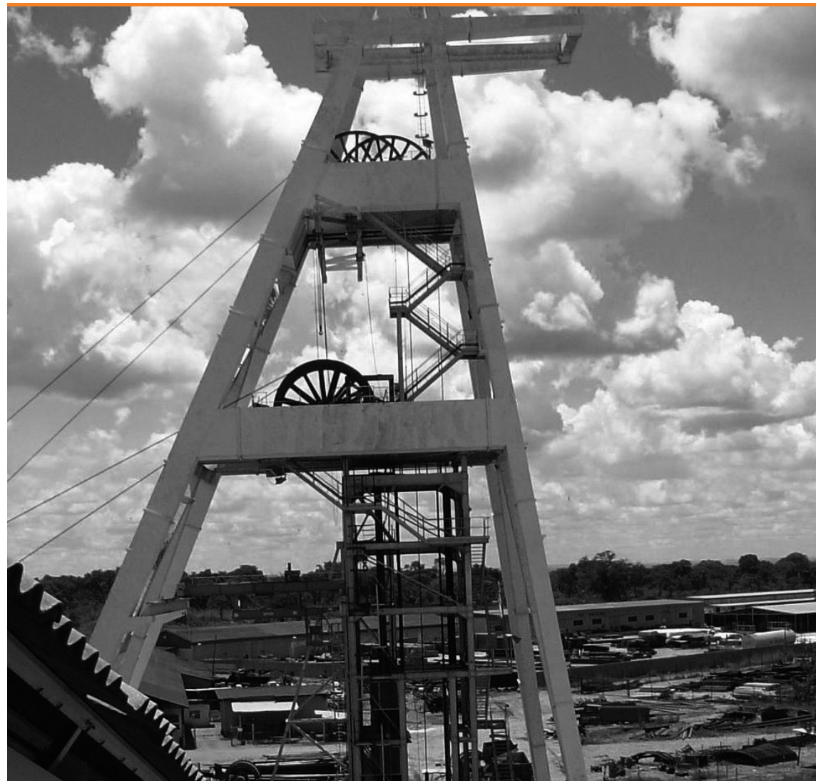
Fotografía de una de las infraestructuras de la Chambishi Copper Mine, empresa administrada por la República Popular China en Zambias.