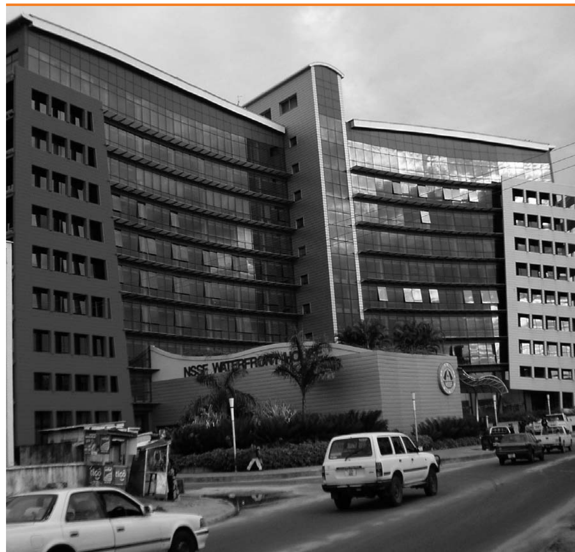
Edificio de la Seguridad Social en Dar es Salaam (Tanzania), construido con la colaboración del estado chino