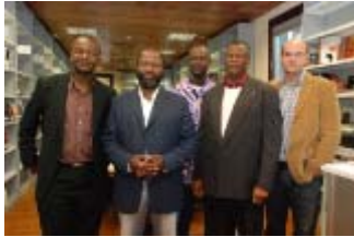
Imagen de los participantes en las jornadas sobre las teleseries africanas

Un productor de Nollywood, un ídolo del culebrón sudafricano más visto y el responsable de uno de los productos televisivos más exitosos de la parrilla nacional se reunieron en Casa África hoy. Su objetivo fue debatir sobre la fórmula de la teleserie en África y, de paso, apadrinar un nuevo servicio gratuito de Casa África: la emisión diaria en acceso libre de canales de televisión africanos.