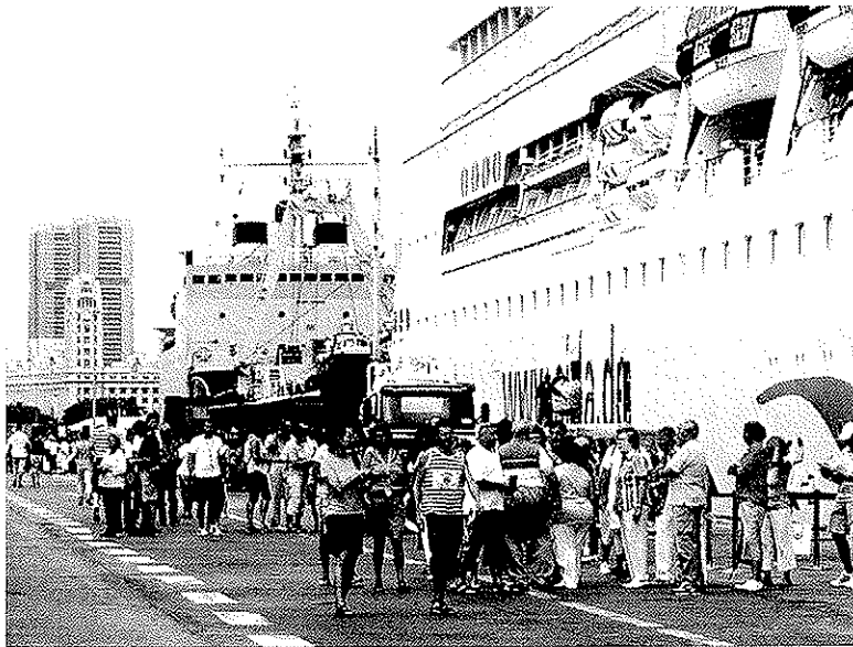
UN GRUPO DE TURISTAS se dispone a visitar Santa Cruz durante la escala de un crucero.

Del mismo modo, el también titular de la Federación de Centros de Iniciativas Turísticas de Tenerife (Feciten) abogó por una modificación en los horarios comerciales de la zona centro con el obje-