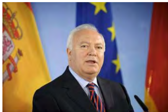
El ministro español de Asuntos Exteriores, Miguel Ángel Moratinos.

Arrecife (España).- La isla española de Lanzarote acoge hoy la primera reunión del foro Atlántico Sur, una iniciativa impulsada por España y Portugal, en la que participan Francia y diez países de América Latina y África y cuyo objetivo es entablar proyectos de cooperación entre ambas orillas del océano.