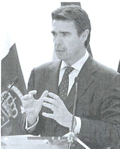
Soria se reúne con el ministro de Economía de Guinea Ecuatorial.

Así, las ponencias matutinas aproximarán a los asistentes las líneas básicas de la economía de Guinea Ecuatorial, tanto desde un punto de vista macroeconómico