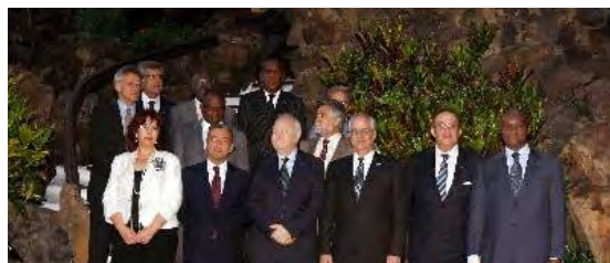
El ministro de Asuntos Exteriores, Miguel Ángel Moratinos (3ª primera fila), posa junto a la presidenta del Cabildo Insular de Lanzarote, Manuela Armas; el presidente canario Paulino Rivero (2ª); el ministro de Exteriores de Argentina, Jorge Taiana (3ª), y al ministro de Exteriores portugués, Luis Amado (c. segunda fila), durante la foto de familia de la primera reunión de la iniciativa del Atlántico Sur.

La reunión concluirá mañana con una sesión plenaria en un hotel en Costa Tegui.