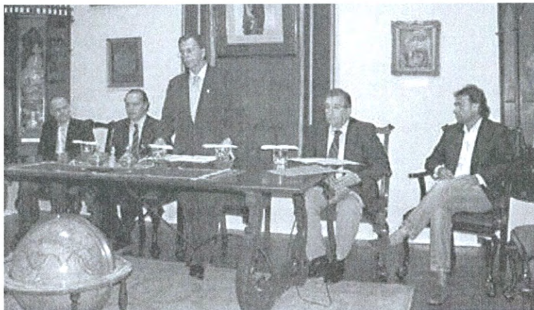
Imagen de un momento de la celebración del seminario de la Real Sociedad Económica.

Para el especialista, “el control del crecimiento solo puede conseguirse con la adecuada zonifi-