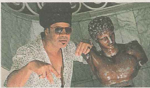
El cantante y compositor Carlinhos Brown, durante la presentación de su último disco, 'Mixturada Brasileira'.

la que su receta frente a la adversidad pasa por aprender, compartir y abrazar la alegría, sin perder de vista los problemas ni repudiar la tristeza. "Lo que no quiero es el dolor", reconoce el cantante que sacó ayer