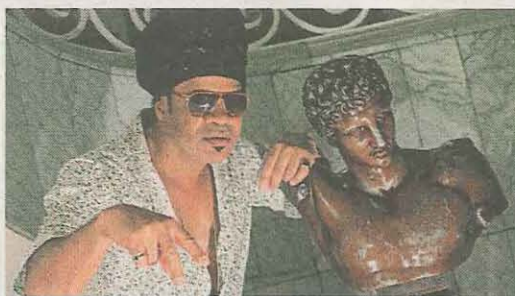
El cantante y compositor Carlinhos Brown, durante la presentación de su último disco, 'Mixturada Brasileira'.

la que su receta frente a la adversidad pasa por aprender, compartir y abrazar la alegría, sin perder de vista los problemas ni repudiar la tristeza. "Lo que no quiero es el dolor", reconoce el cantante que sacó ayer