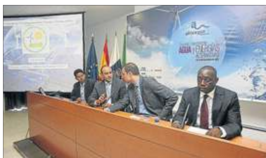
Países africanos. Gambia, Cabo Verde, Mauritania y Senegal participaron.

Las jornadas de Africagua, organizadas por Maxometal, la Cámara de Comercio, el Instituto Tecnológico de Canarias y Proexca, se plantean también con el fin de buscar soluciones a los problemas de abastecimiento de agua en las ciudades y aldeas africanas, y abordar el escenario actual que presenta el suministro de energía en el continente.