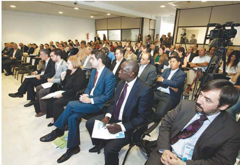
Asistentes al encuentro internacional Africagua Canarias, celebrado, ayer, en Puerto del Rosario.