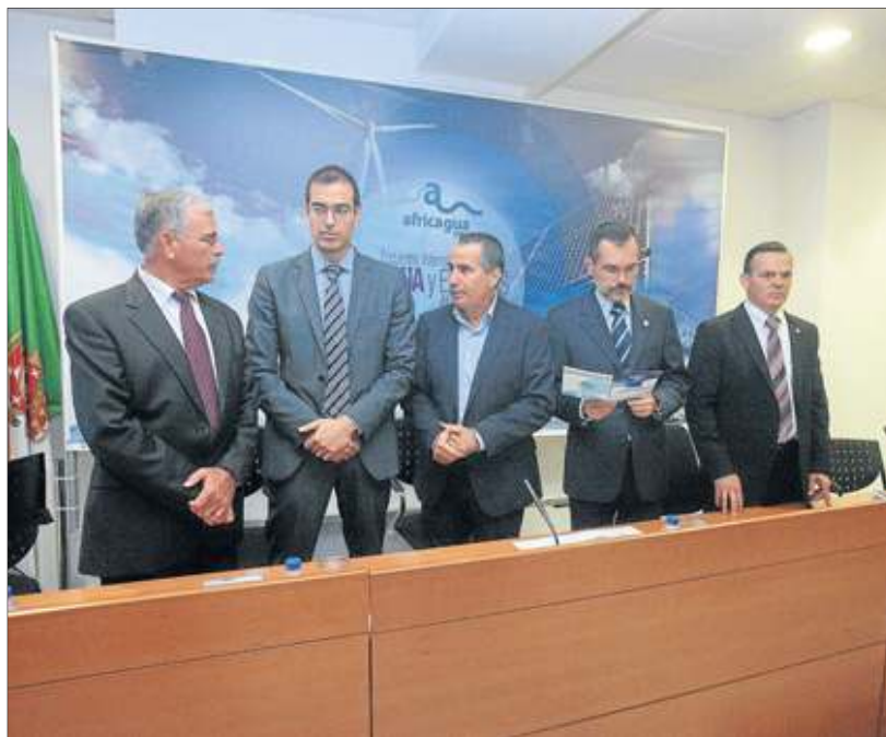
Encuentro empresarial. Africagua representa la apuesta del empresariado canario por la internacionalización.

Africagua es la apuesta de los empresarios canarios por la internacionalización y la búsqueda de nuevas oportunidades de negocio en otros países. Mauritania, Cabo Verde, Gambia, Senegal y España figuran con naciones participantes. Empresarios y representantes de gobiernos extranjeros y otras institu-