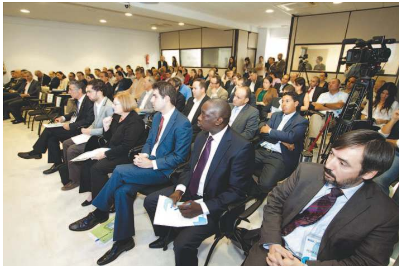
Imagen de las jornadas Africagua Canarias 2011, celebradas recientemente en Puerto del Rosario.

Africagua Canarias 2011 estuvo organizado por la Cámara de Comercio de Fuerteventura, Maxometal, el Cabildo de Fuerteventura, Proexca, Instituto Tecnológico de Canarias (ITC) y el Instituto Español de Comercio Exterior (ICEX). Colaboraron en esta convocatoria Casa África, AFRICAinformat, RICAM, Enterprise Europe Network (EEN), Asociación de empresarios de Hostelería y Turismo de Fuerteventura, Cámaras Canarias y la Confederación de Empresarios de Fuerteventura (CONFUER).