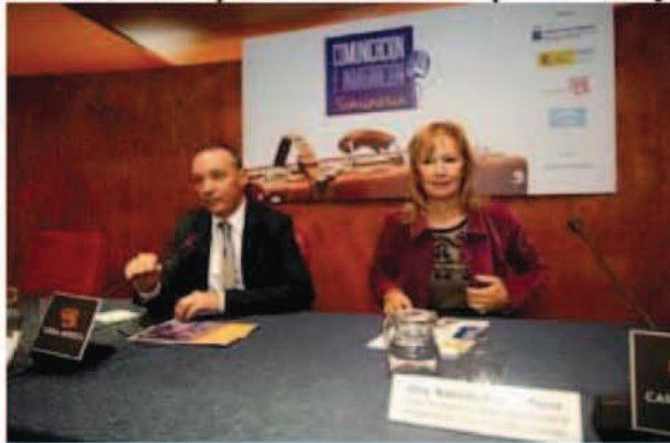
Presentación del seminario 'Comunicación e Inmigración' en Casa África.

Casa África acogió este viernes un seminario que bajo el título Comunicación e Inmigración ha reunido a profesionales del periodismo y miembros de la sociedad civil para reflexionar y debatir sobre el tratamiento de la inmigración en los medios de comunicación.