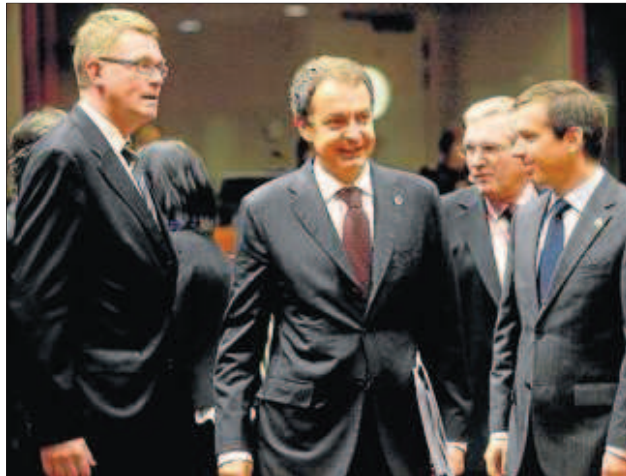
Bruselas. El presidente español (centro), rodeado de dirigentes de otros países europeos.

En ese foro, además de las siete regiones ultraperiféricas -los cuatro departamentos franceses de ultramar (Guadalupe, Guayana, Reunión y Martinica), las regiones portuguesas de Azores y Madeira y las españolas islas Canarias- tendrán cabida todos los