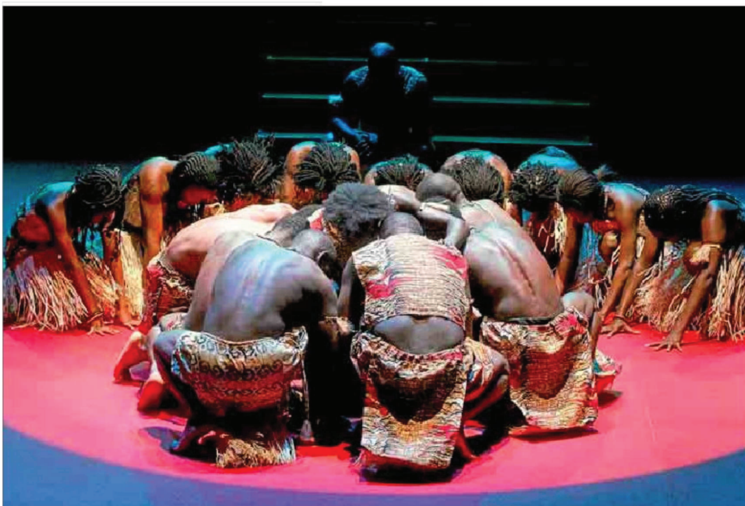
Un momento del espectáculo 'Orígenes', dirigido por Santiago Sánchez, que se pone en escena en las Naves del Español.

Con él estará en el escenario Chacho Brodas; el malagueño Rafael Fernández, profesionalmente Capaz, Diversidad, Gregtown (banda que nació a finales de 2007 en el Barrio del Pilar de Madrid con el pretexto de hacer new roots reggae en castellano con un mensaje consciente y social) y Hombres Púa.