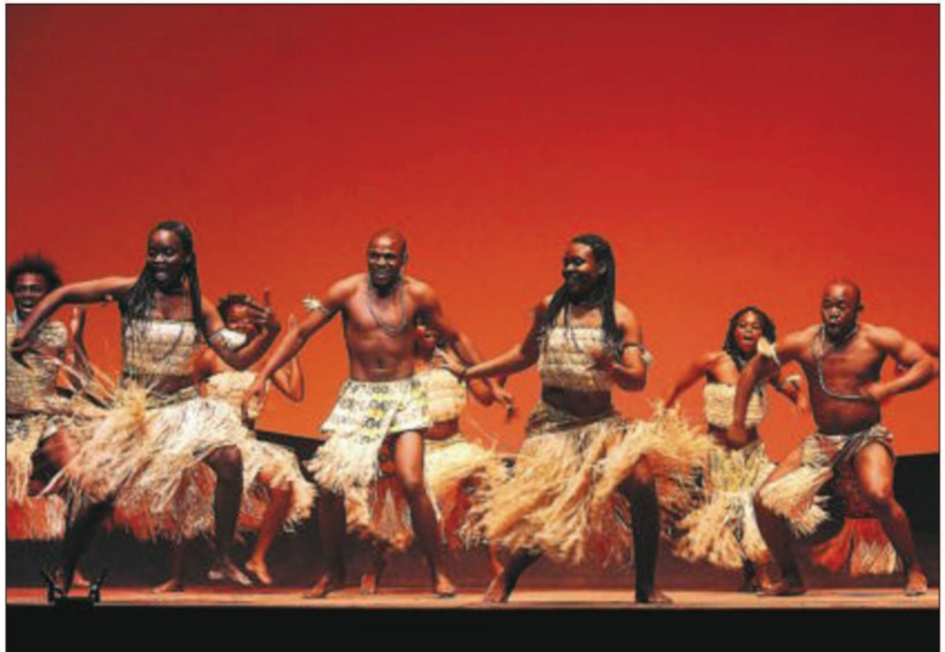
Danzas guineanas del espectáculo Orígenes de L'Om Imprebis.

» Erotismo cabaretero. Dos de los teatros del circuito off de Madrid ofrecen este fin de semana sendas sesiones golfas donde el humor y la trasgresión son los protagonistas. Por una parte, la sala Tarambana (C/ Dolores Armentot, 31; hoy y mañana, a las 23.30; entrada: 12 euros con con-