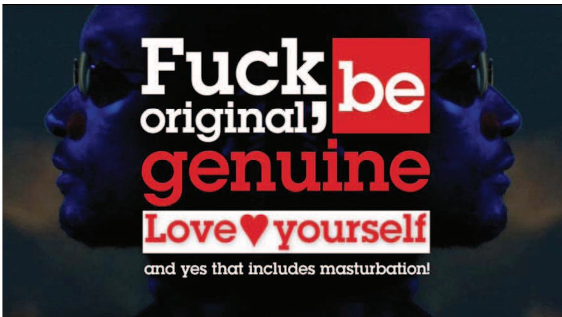
Nástio Mosquito. Manifesto #5 (DZzz), 2008

Nástio Mosquito llevará acabo una intervención específica en el stand de Arte inVisible en ARCO 2009, diseñando un espacio de documentación sobre los colectivos y plataformas artísticas africanas.