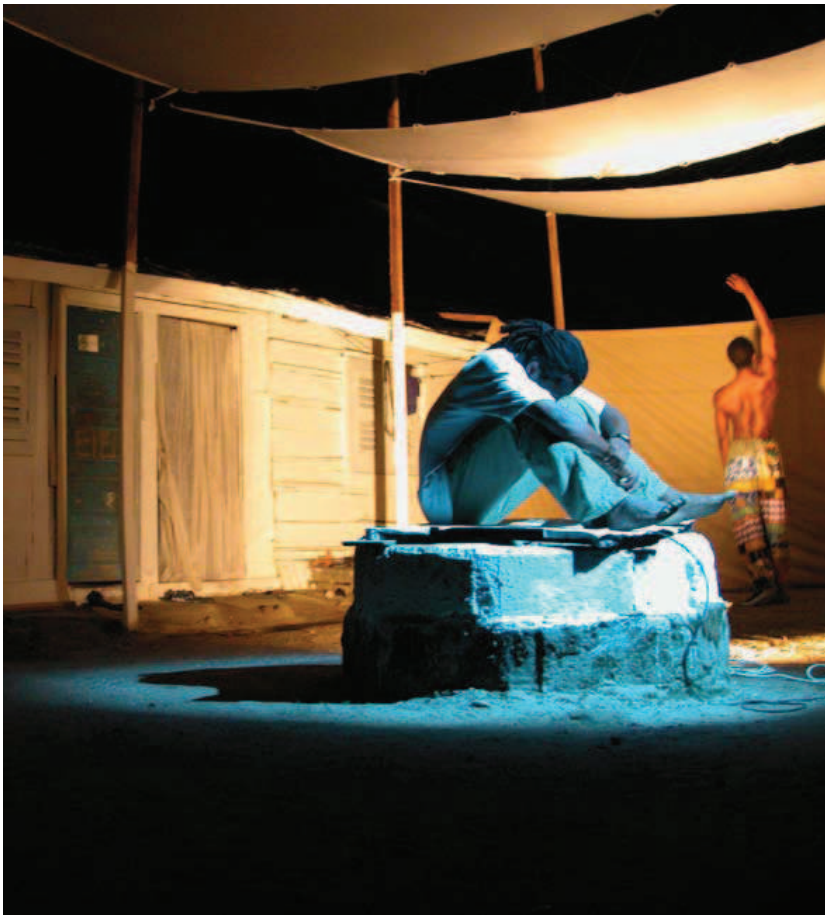
Cercle Kapsiki. Instantánea de la performance de Hervé Yamguen, uno de los miembros del Cercle Kapsiki, en Scenographies urbaines , Douala, Camerún, 2002.

http://www.eternalnetwork.org/scenographiesurbaines/index.php?cat=doualacolectif