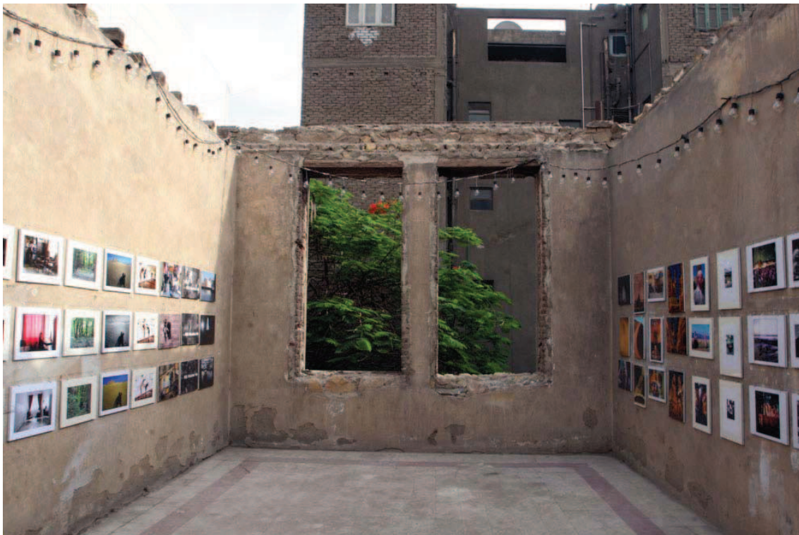
CIC. Imagen de la instalación de su proyecto Raffle on the roof , 2005