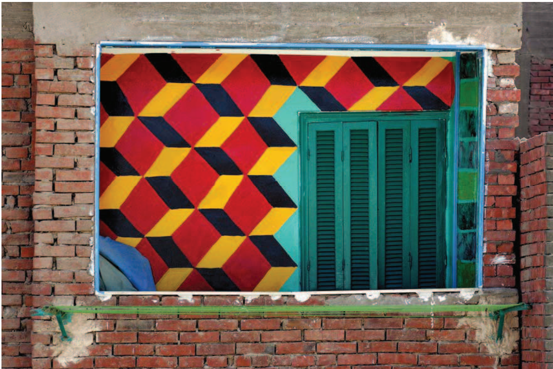
Rana El Nemr. Balcony #93, 2003.

En esta edición la artista egipcia revisa una específica localización del El Cairo, a través una instalación audiovisual titulada Olympic Garden.