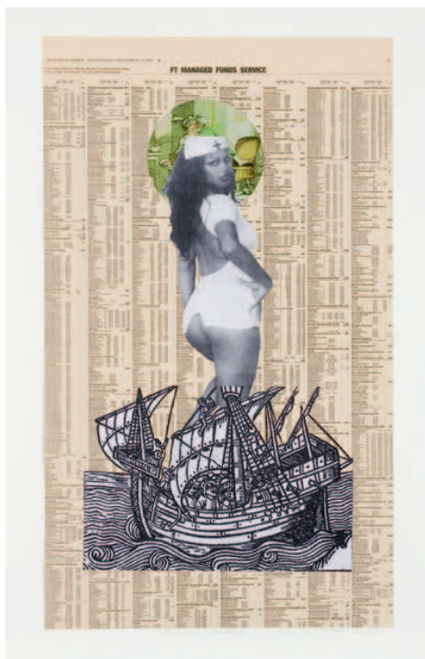
Godfried Donkor , Browning Madonna, 2003

Collage sobre papel Collage on paper 64 x 48 cm