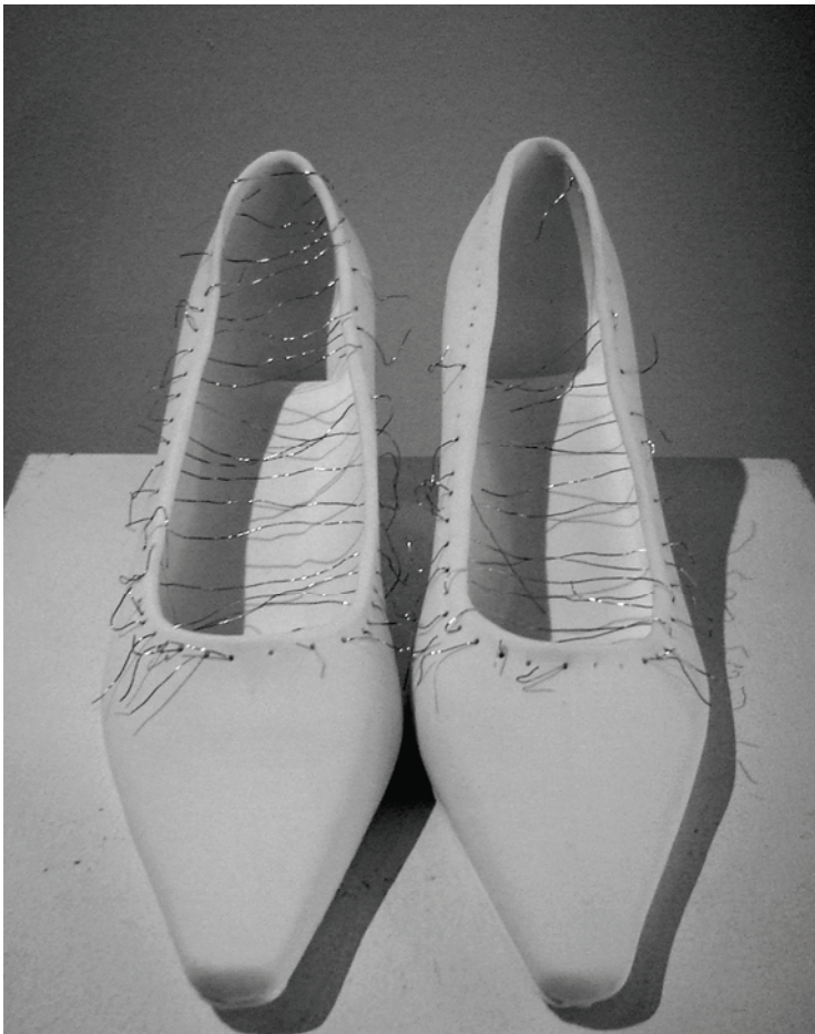
Safaa Erruas. Fashion shoe, 2007