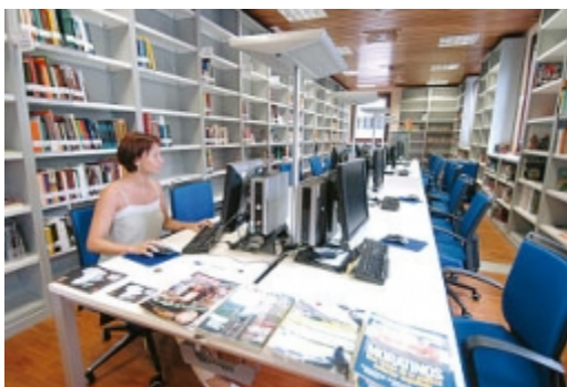
Mediateca de Casa África

Siempre se ha dicho que el ser humano saca lo mejor de sí mismo ante las mayores adversidades. África, continente que inunda los medios de comunicación a través de la inmigración, las guerras y la pobreza, es un gran ejemplo de ello. Numerosos escritores, músicos, directores de cine, investigadores... intentan superar esa cara tan demacrada a través de la cultura, recibiendo muchas veces la indiferencia de un mundo que no logra extender su mirada artística más allá de Occidente.