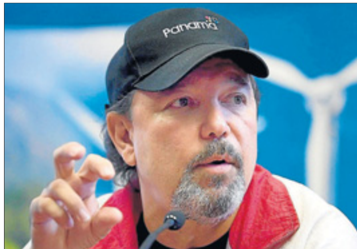
Gira. Blades actuó anoche en Tenerife.

El director de la Orquesta Sinfónica de Tenerife (OST) Lü Jia considera magnífica la acústica del teatro Leal, una vez que se realizó una prueba de sonido a la que se prestó de forma altruista la orquesta Camerata Lacunensis, hasta el punto de que no habrá ensayo general de la OST antes del concierto inaugural.