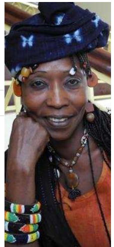
Fatimata Coulibaly, actriz r toda África