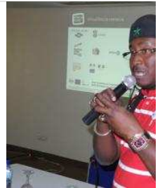
Didier Awadi, padre del Hip

Cinco años de críticas e inquietudes que han desembocado en "El punto de vista del león" una película que "habla de nuestro punto de vista de la inmigración no es la mirada de occidente , ni de la de los antiguos colonos, es el punto de vista de los africanos, ¿por qué viajan? ¿que hay detrás? es el punto de vista de nuestro continente que lo explica todo. Para mí es una política global que responsabiliza tanto a los gobernantes occidentales como a los africanos, que da la palabra ala población local, que plantea la búsqueda de soluciones para evitar que lo mejor de nuestra sociedad, los jóvenes se mueran en el camino, nos preguntamos qué sucede para que tantas personas quieran dejar el continente" sentencia con el buen discurso político que le caracteriza.