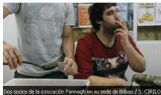
Dos socios de la asociación Pannagh en su sede de Bilbao.

- Un ángel de la muerte recorre los foros de Internet