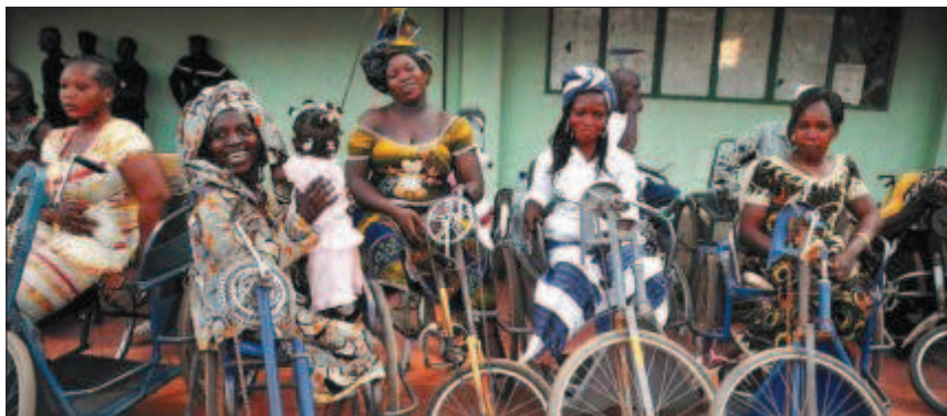
Participantes en el festival de cine de Uagadugú.