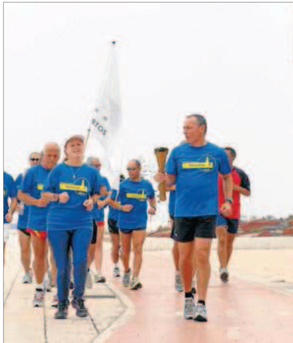
Encendido. La antorcha de la Semana Deportiva del Puerto, ayer rumbo al Muelle.

El pistoletazo de salida de la fiesta se dará a las 09.00 horas en la zona del centro comercial El Muelle, con el arranque de la media maratón de la Fundación Puertos de Las Palmas. Le seguirán, desde las 10.00 horas las actuaciones de escolares, los talleres abiertos al público, un pasacalles y una actuación con música y danza africanas a cargo de Afrocanarias. Este entorno lúdico y espacio de encuentro y conocimiento mutuo entre africanos y canarios también será el escenario en el que reciban su trofeo los vencedores del 1 Torneo de Fútbol 7 África Vive, que desde abril reúne a diez selecciones nacionales africanas y que celebrará su final hoy sábado, en el campo Manuel Naranjo