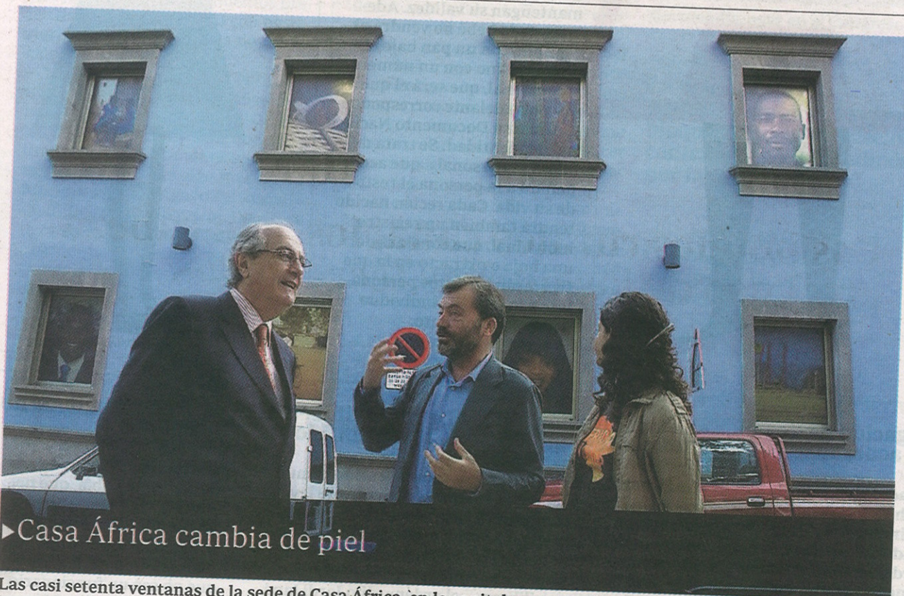
► Casa África cambia de piel

La proyección de la cinta de Miguel Albadalejo «Nacidas para sufrir» inaugura a las ocho y media de la tarde el ciclo «Cine español en ruta» en la isla. Durante los próximos cinco jueves, el Centro Bibliotecario Insular de Puerto del Rosario acogerá la exhibición de otras tantas películas españolas producidas en el último año y medio.