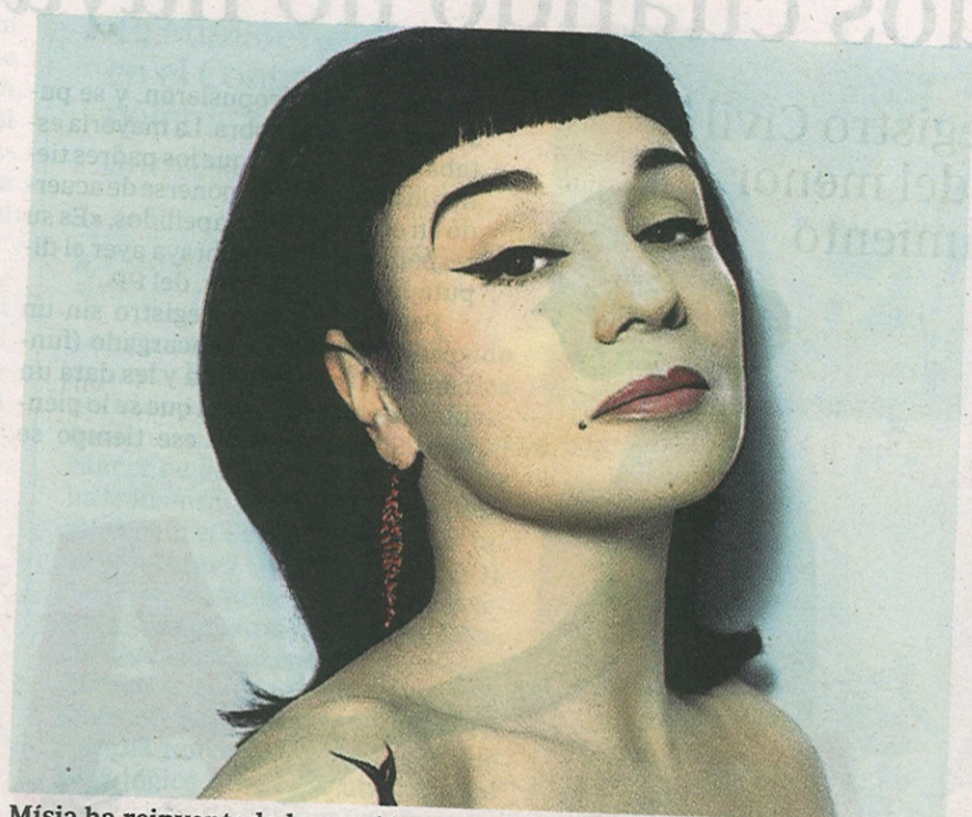
Misia ha reinventado la canción popular portuguesa

Sin embargo, es cierto que Misia es una pionera, un espíritu libre. Tenien-