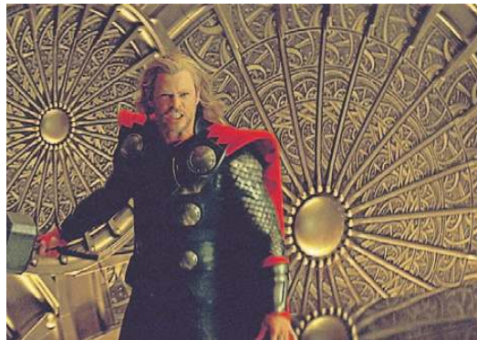
Chris Hemsworth en 'Thor'.

| Película: Thor. | Dirección: Kenneth Branagh. | Intérpretes: Chris Hemsworth, Natalie Portman, Anthony Hopkins, Stellan Skarsgård. | Guión: Mark Protosevich. | Género: Ciencia-ficción. | Duración: 130 minutos. | País: Estados Unidos, 2011