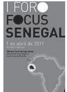
Cartel de la cita empresarial.

Las mayores alzas se produjeron en los sectores de bebidas y madera, que son, por ahora, áreas con opciones de negocio.