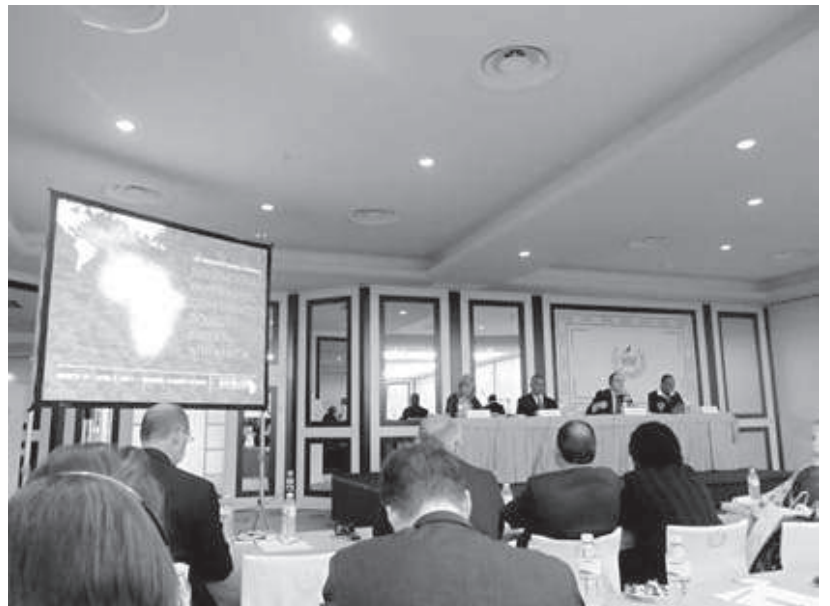
Panel sobre aviación, en la Conferencia Internacional, ayer en Adeje.