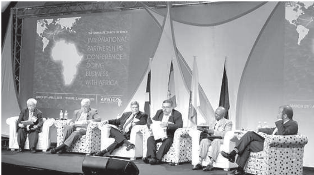
Debate sobre la creación de alianzas para invertir en África, ayer en el hotel Bahía del Duque (Adeje).