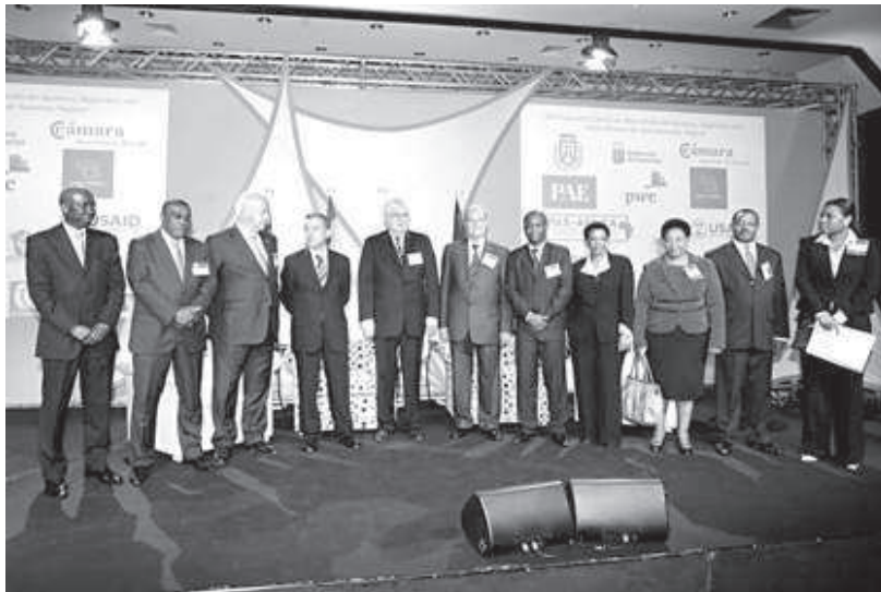
Las autoridades, portavoces y representantes africanos, estadounidenses y canarios.