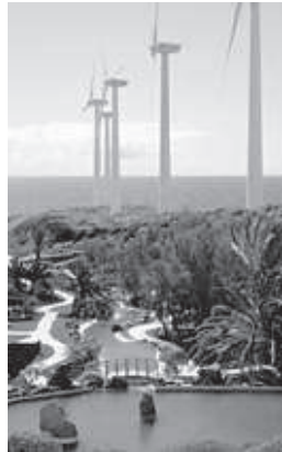
Instalaciones del ITER.