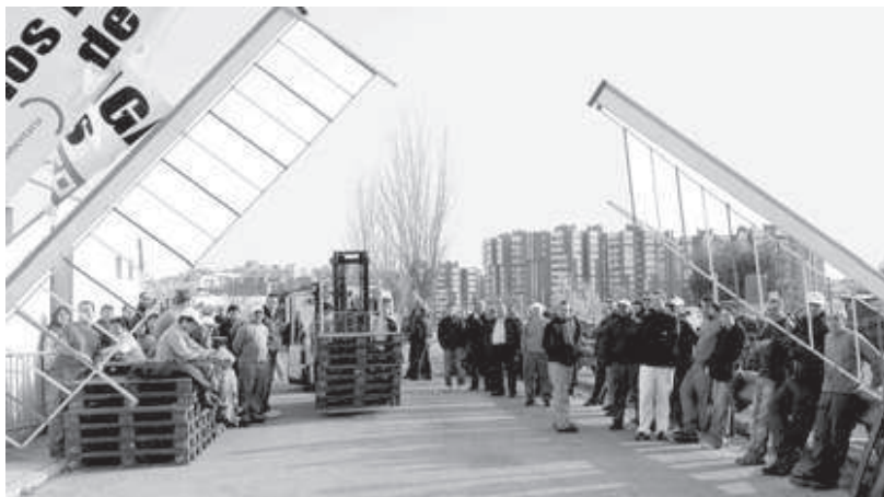
Imagen de archivo de los trabajadores de una de las empresas de Nueva Rumasa, en una protesta.

De la mano de Casa África , este encuentro empresarial contará además, con una amplia representación diplomática, encabezada por el embajador de EE. UU. en la Unión Africana, los embajadores de Namibia, República del Congo y Tanzania, así como otros representantes de las embajadas de Zimbabue y Camerún. Todos ellos participarán en los diversos seminarios y mesas de trabajo monográficas