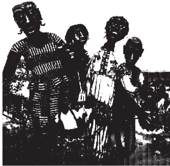
Los gigantones de Burkina Faso. El Norte

Si el término titiritero ha soportado, y en cierta forma sigue hacién-