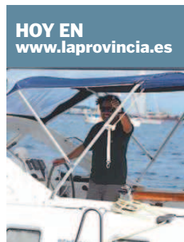
Un tripulante del 'Winner'.