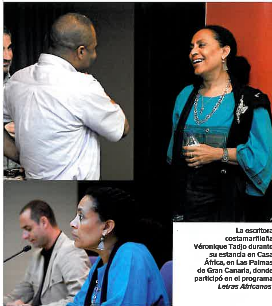
La escritora costamarileña Véronique Tadjo durante su estancia en Casa África, en Las Palmas de Gran Canaria, donde participó en el programa Letras Africanas.

bre de una causa "justa". Hoy, Tadjo se pregunta si los niños soldados no son una ilustración contemporánea de este fenómeno.