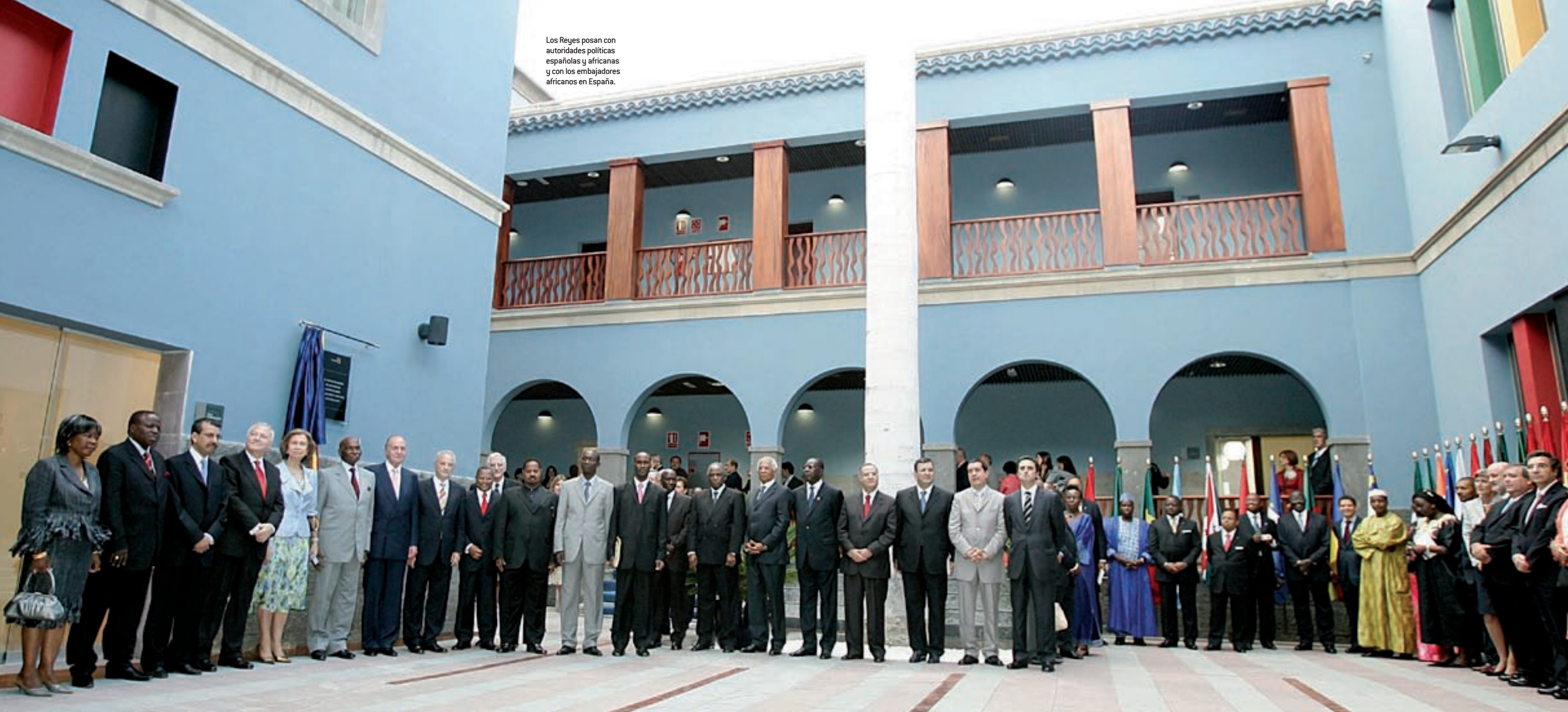
Los Reyes posan con autoridades políticas españolas y africanas y con los embajadores africanos en España.