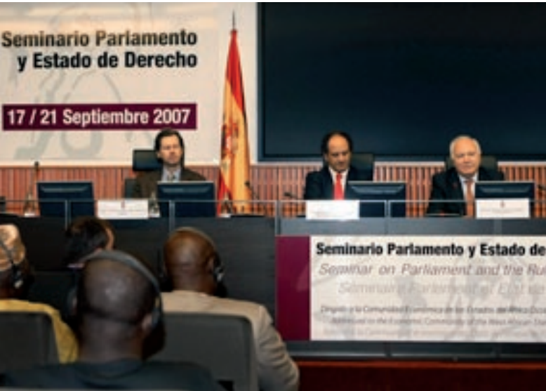
Imagen de la inauguración del Seminario "Parlamento y Estado de Derecho", que tuvo lugar en el Congreso de los Diputados bajo la presidencia del ministro de Asuntos Exteriores y Cooperación, Miguel Ángel Moratinos, el 17 de septiembre de 2007