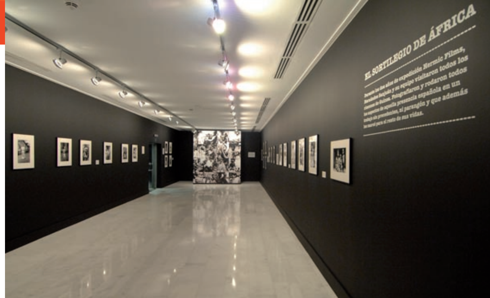
Imágenes de la exposición “Mbini. Cazadores de imágenes en la Guinea Ecuatorial”.