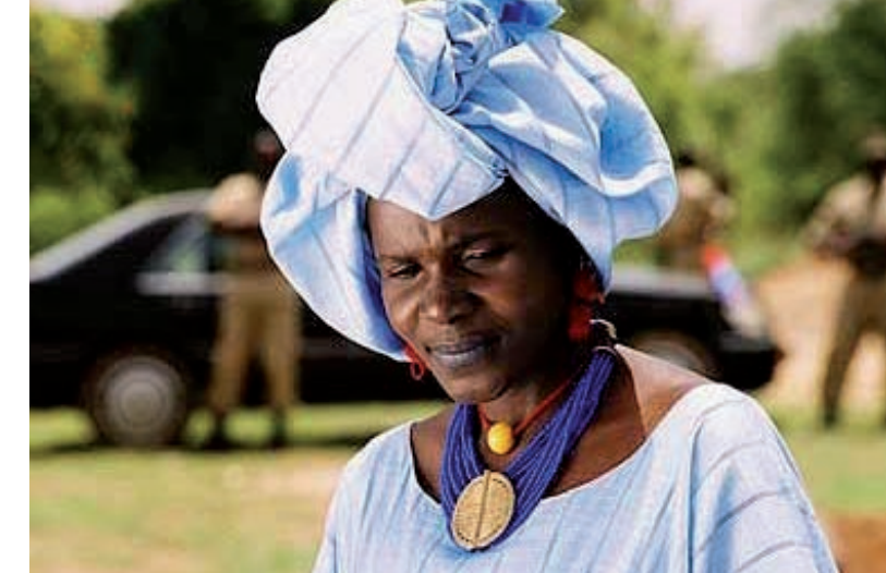
Fotograma de una de las películas exhibidas en la edición del año 2007 del Festival de Cine Africano de Tarifa.

Además, la Ministra de Cultura de Gambia tomó parte en los actos que se desarrollaron en Las Palmas de Gran Canaria.