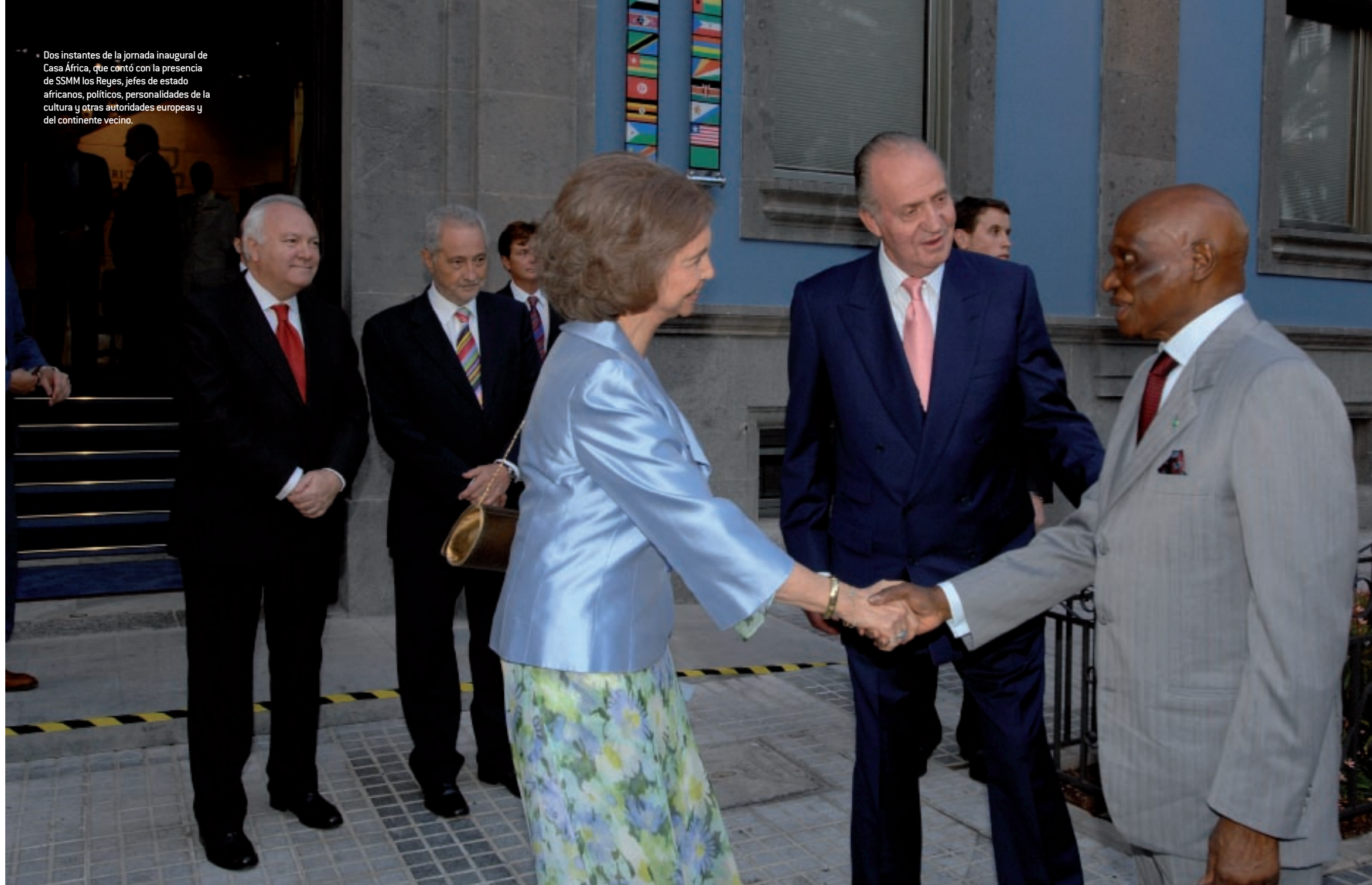
• Dos instantes de la jornada inaugural de Casa África, que contó con la presencia de SMM los Reyes, jefes de estado africanos, políticos, personalidades de la cultura y otras autoridades europeas y del continente vecino.