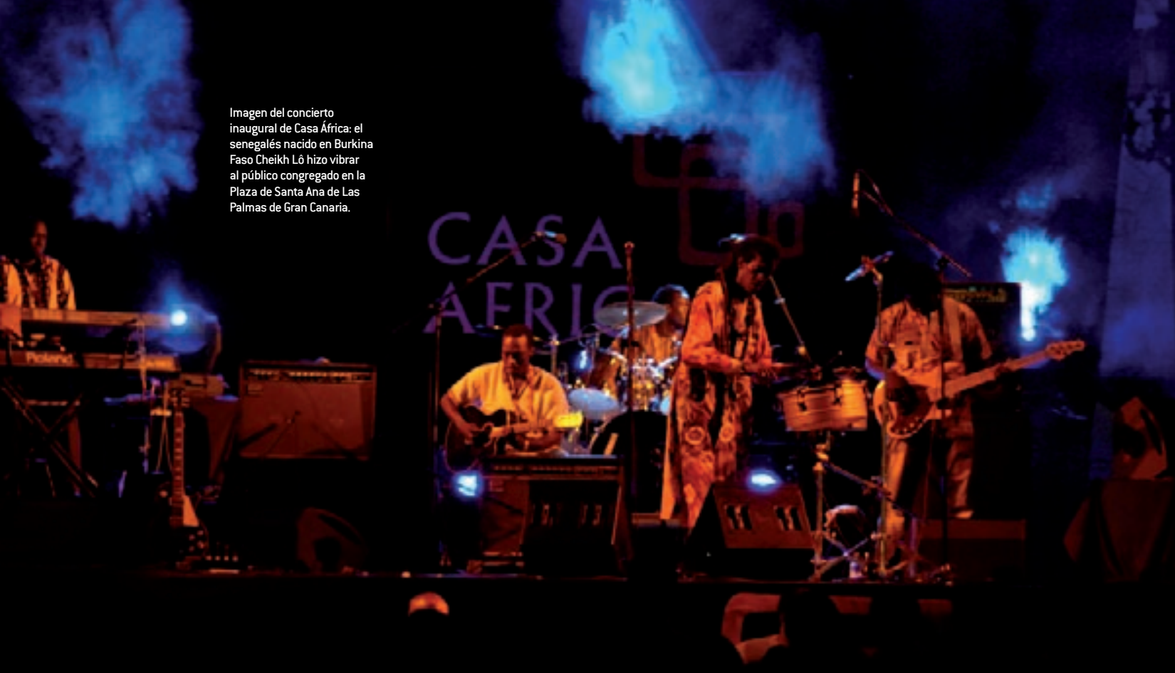
Imagen del concierto inaugural de Casa África: el senegalés nacido en Burkina Faso Cheikh Lô hizo vibrar al público congregado en la Plaza de Santa Ana de Las Palmas de Gran Canaria.

y a la vida contemporánea, en el África Subsahariana.