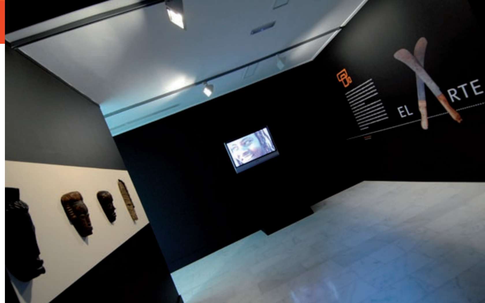
Imágenes de la exposición "El Arte de Vivir".