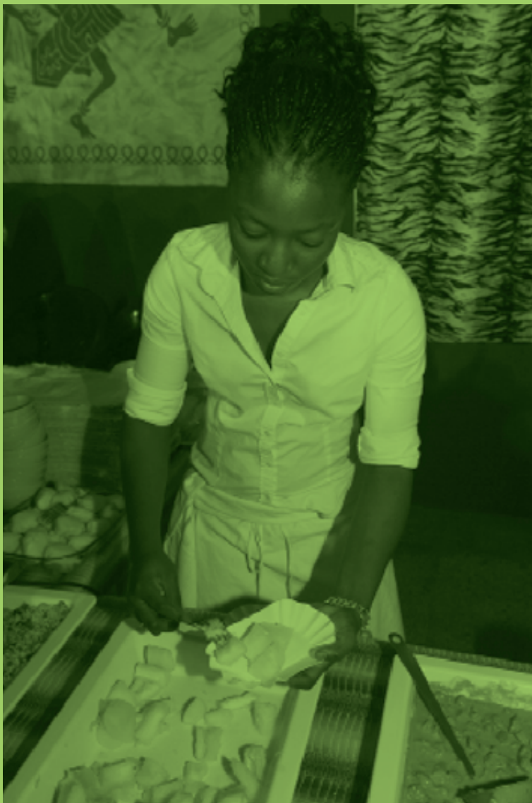
Casa África posibilitó la creación de una iniciativa de gastronomía africana, como espacio en el que acercar los mejores sabores del continente vecino a los paladares de cientos de comensales españoles.