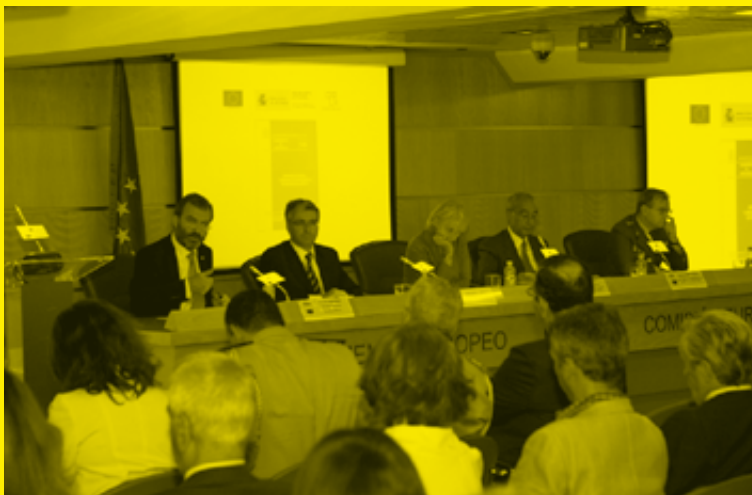
Imagen de la presentación del Cuaderno de Estrategia editado por el Instituto de Estudios Estratégicos del Ministerio de Defensa y Casa África: Respuesta europea y africana a los problemas de seguridad en África .