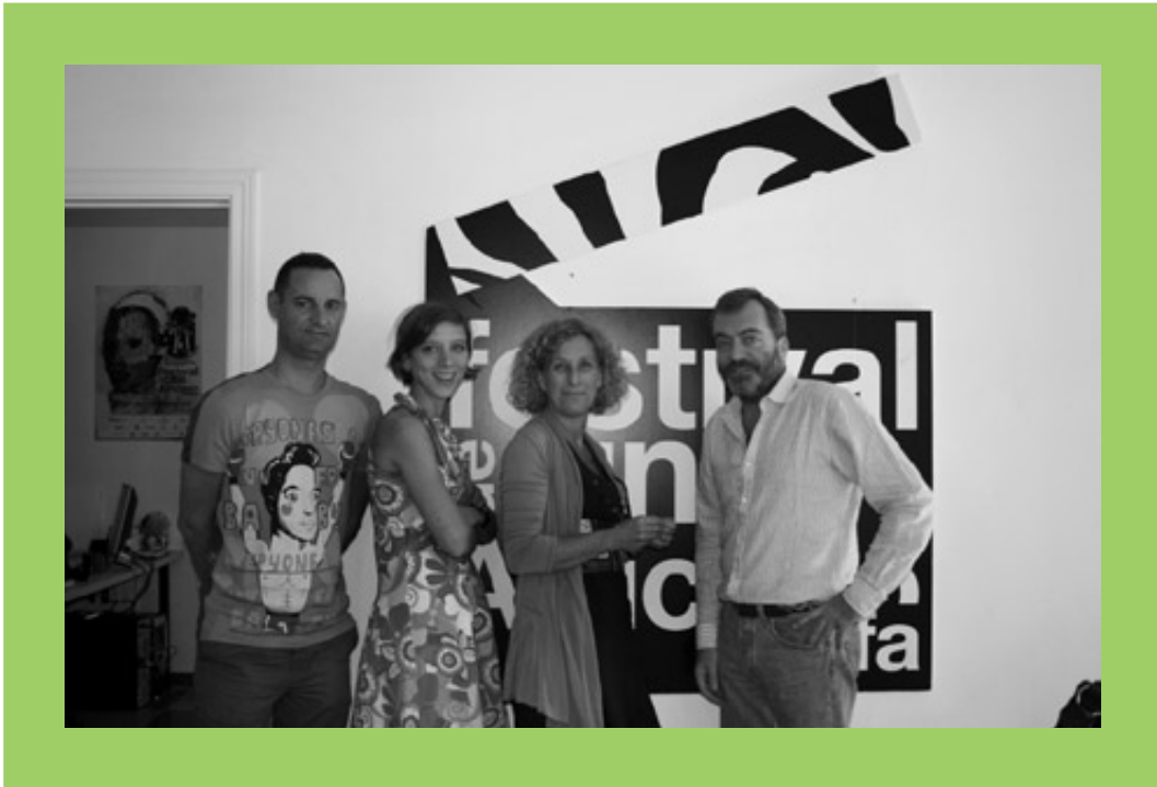
El Festival de Cine Africano de Tarifa (FCAT) y Casa África firmaron un convenio para incrementar el conocimiento de las cinematografías africanas en España. El festival y la institución tienen una relación de colaboración muy estrecha, que se concreta, entre otros proyectos, en el Festival de Cine Africano de Guinea Ecuatorial y al programa Cinenómada .