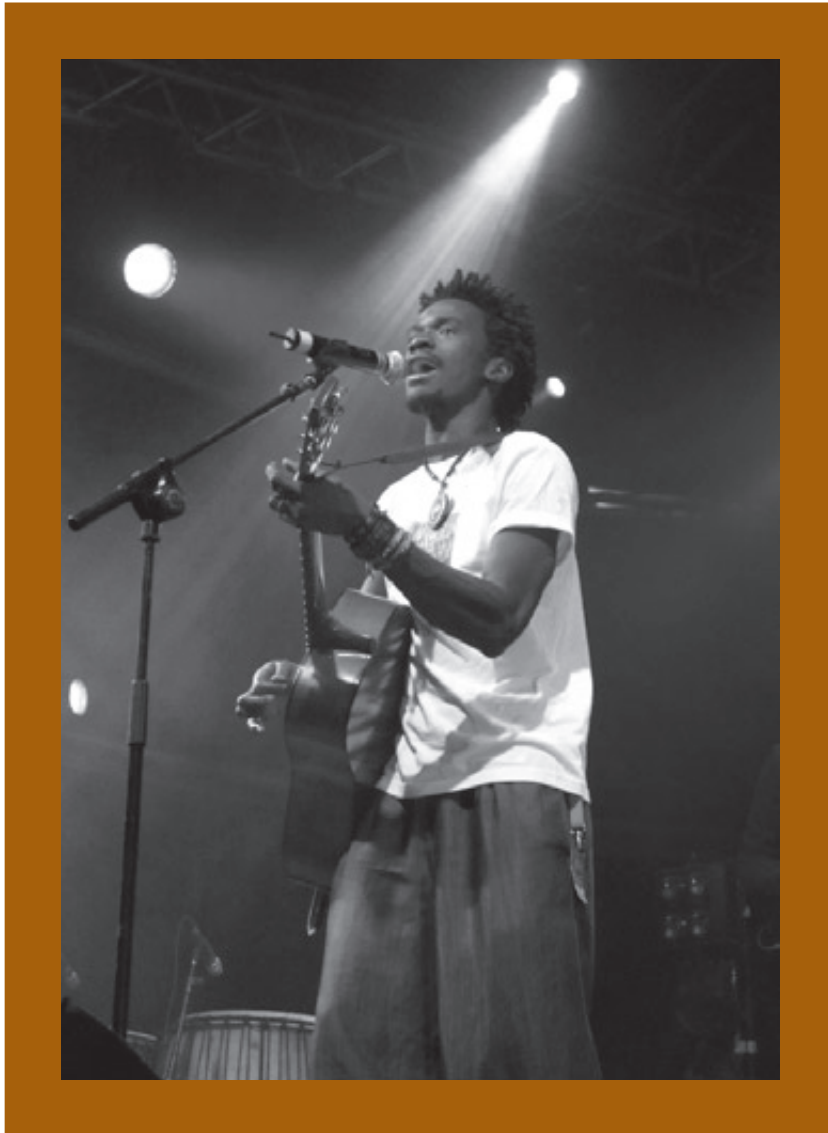
Takeifa, un grupo senegalés que triunfó en diferentes citas musicales por España de la mano de Casa África y que brilló en el Dakar Vis-à-Vis , una iniciativa de Casa África en colaboración con la Sociedad General de Autores y Editores (SGAE), que propicia el encuentro entre músicos africanos y los productores y programadores de los principales festivales de música españoles.