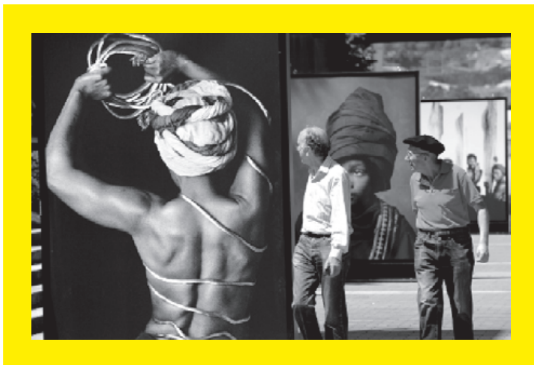
Casa África, en el marco de África Vive 2010, llevó a las calles de Bilbao la exposición fotográfica de la camerunesa Angèle Etoundi Essamba, bajo el título Desvelos .