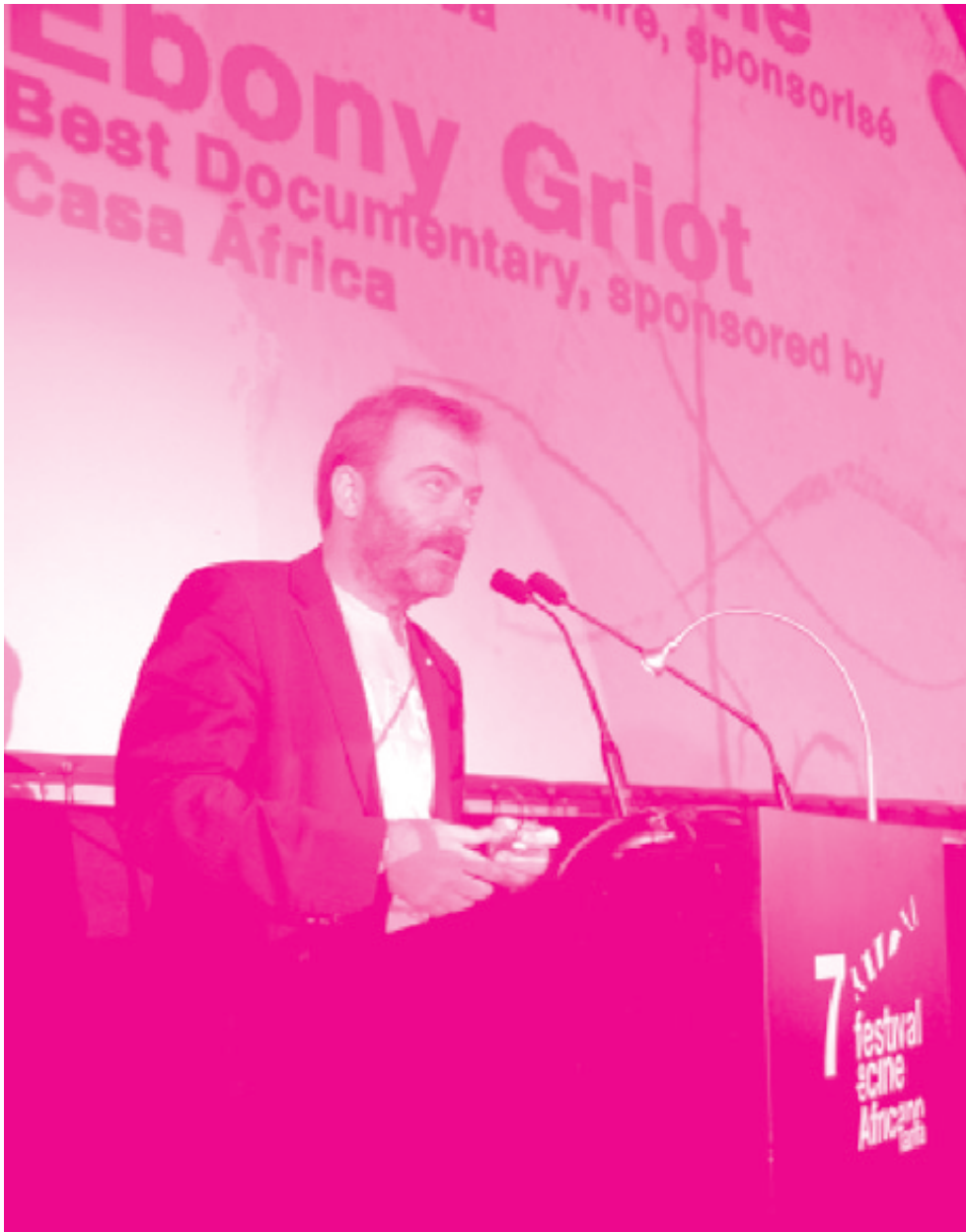
El Director General hizo entrega del premio Griot de Ébano al mejor documental en el Festival de Cine de Tarifa (FCAT). Éste y otros festivales como FESPACO (Burkina Faso), el FCA de Guinea Ecuatorial y MiradasDoc (Tenerife) constituyen las apuestas de la política de Casa África en materia de cine.