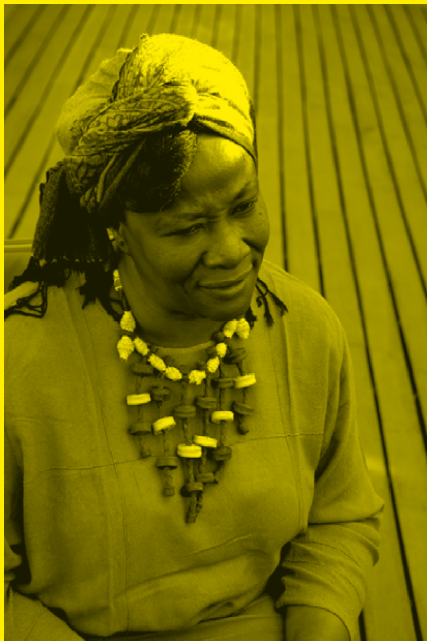
Aminata Traoré, antigua ministra de Cultura y Turismo de Mali y una de las voces más respetadas de África, participó en las II Jornadas Internacionales de Participación y Desarrollo Social de Las Palmas de Gran Canaria organizado por Casa África.