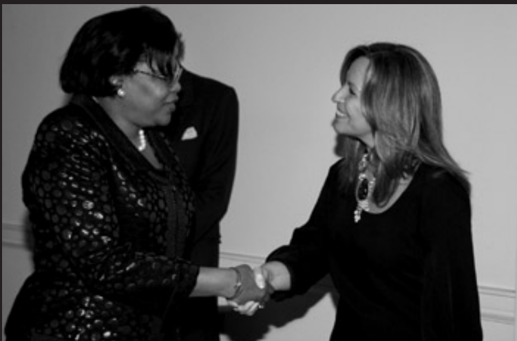
Trinidad Jiménez, Ministra de Asuntos Exteriores y de Cooperación y actual presidenta del Consorcio Casa África con la Embajadora de la República de Mozambique, Fernanda Lichale.

XIV Reunión de la Comisión Delegada. 30.11.2010. Las Palmas de Gran Canaria