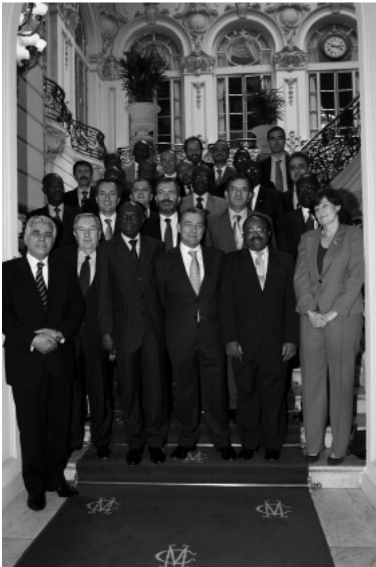
El Presidente del Gobierno de Canarias, Paulino Rivero, presidió la reunión del Consejo Diplomático de Casa África que tuvo lugar en Madrid el 25 de mayo en el marco del Día de África.