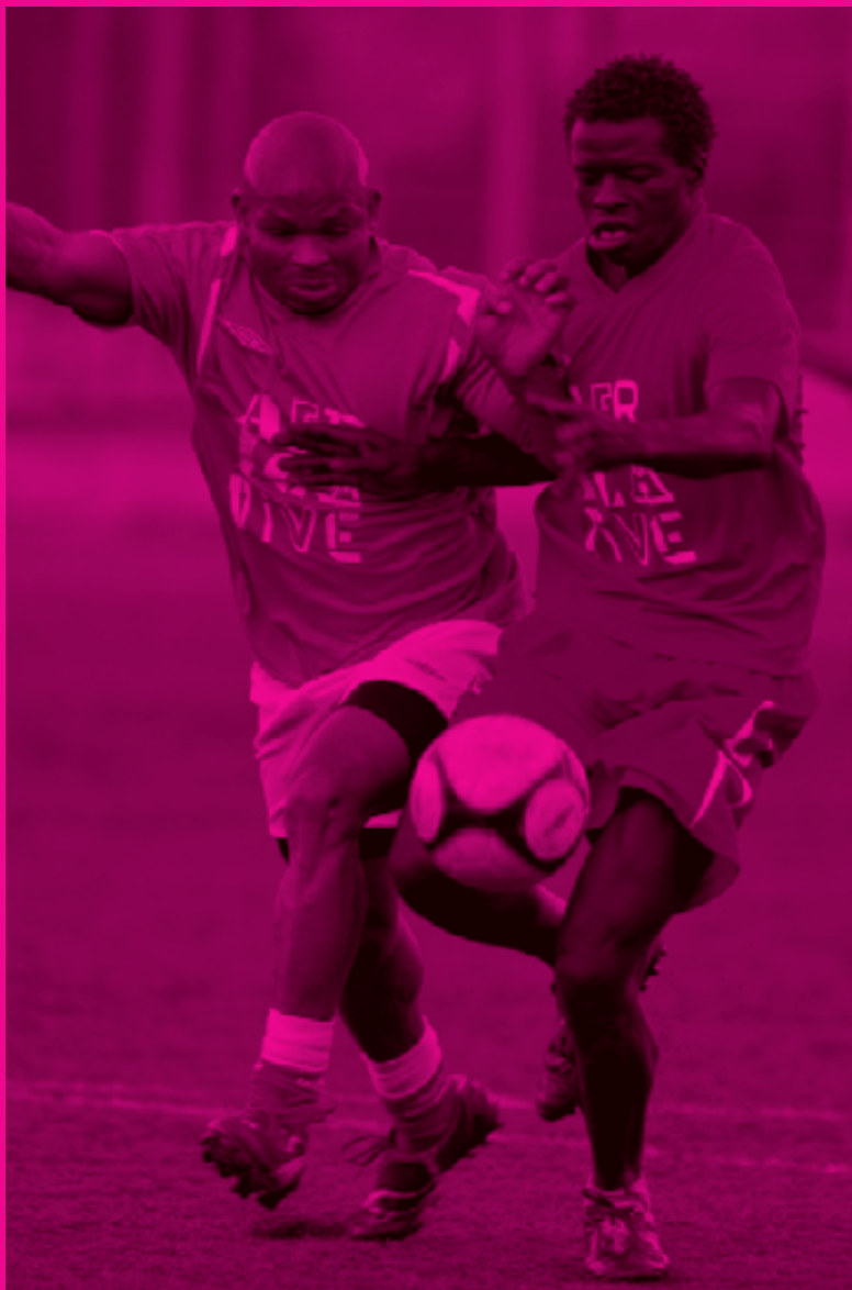
El Torneo de Fútbol 7 África Vive enfrentó a seis selecciones africanas en una suerte de Copa África en el marco del programa África Vive 2010.