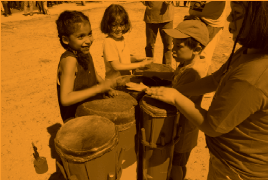
La Fiesta África Vive en Madrid fue una celebración organizada por Casa África que incluyó talleres, juegos, música y gastronomía y que quiso acercar a los asistentes a la cultura africana, de la mano de sus protagonistas.