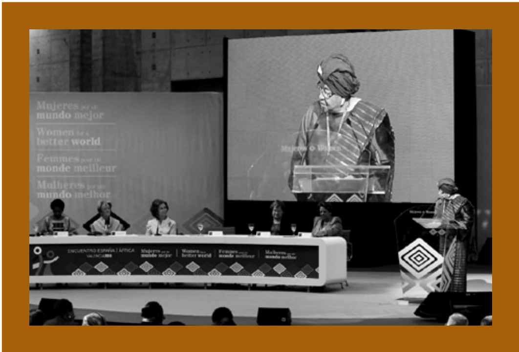
Casa África brindó su apoyo al V Encuentro de Mujeres por un Mundo Mejor, que reunió en Valencia a 500 mujeres, entre las que se encontraban jefas de Estado, ministras, premios Nobel y Príncipe de Asturias y representantes de organismos internacionales.