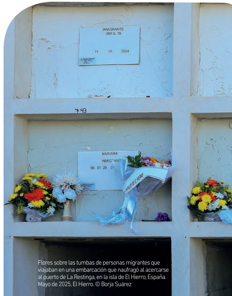
Flores sobre las tumbas de personas migrantes que viajaban en una embarcación que naufragó al acercarse al puerto de La Restinga, en la isla de El Hierro, España. Mayo de 2025, El Hierro.

Asimismo, si bien se han mantenido las principales nacionalidades de llegada registradas en 2024, estas han experimentado algunas variaciones. Así, en 2025, las personas llegadas a costas fueron principalmente originarias de Argelia (27 %), Malí (17 %), Marruecos (15 %) y Senegal