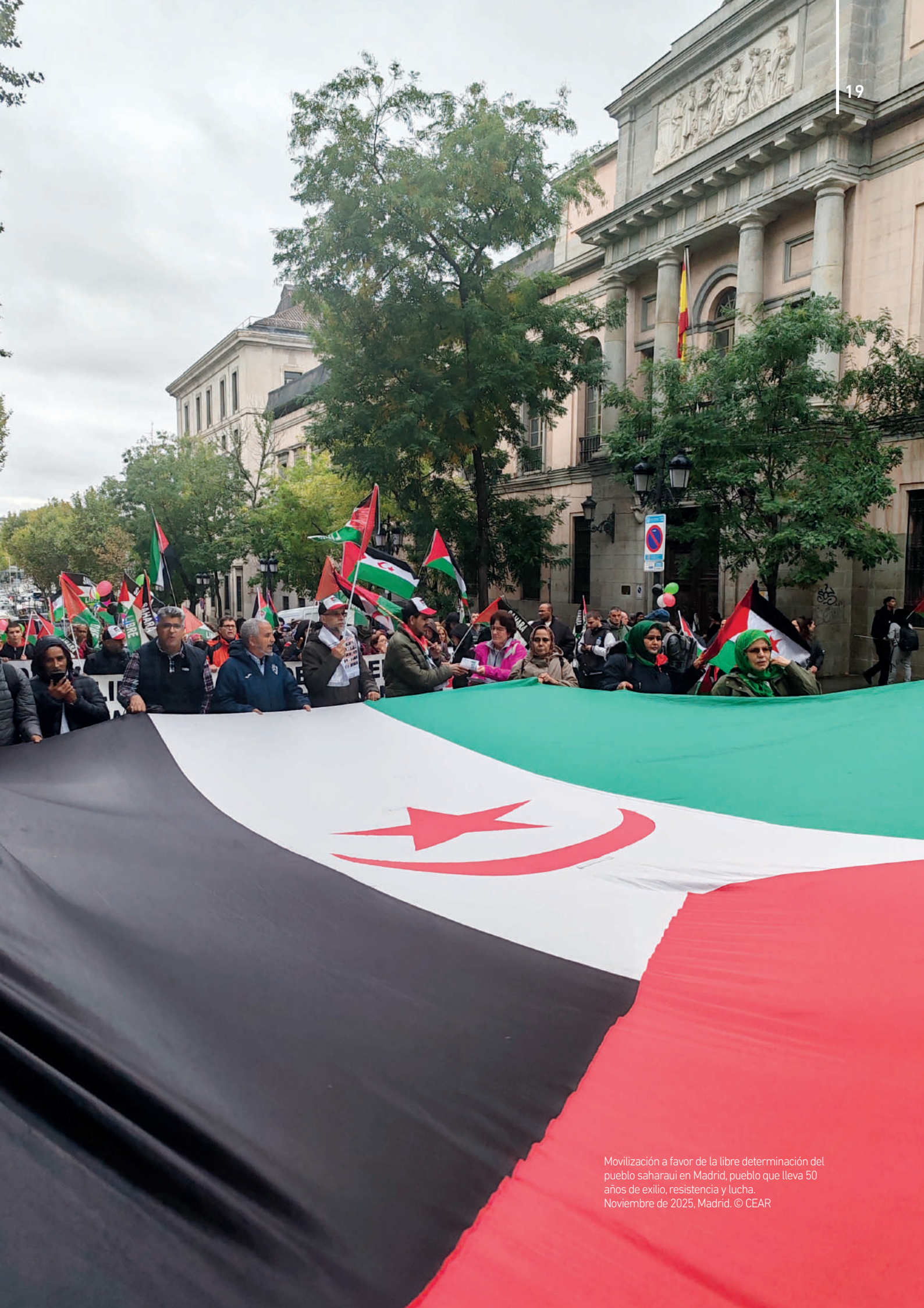
Movilización a favor de la libre determinación del pueblo saharauí en Madrid, pueblo que lleva 50 años de exilio, resistencia y lucha. Noviembre de 2025, Madrid.