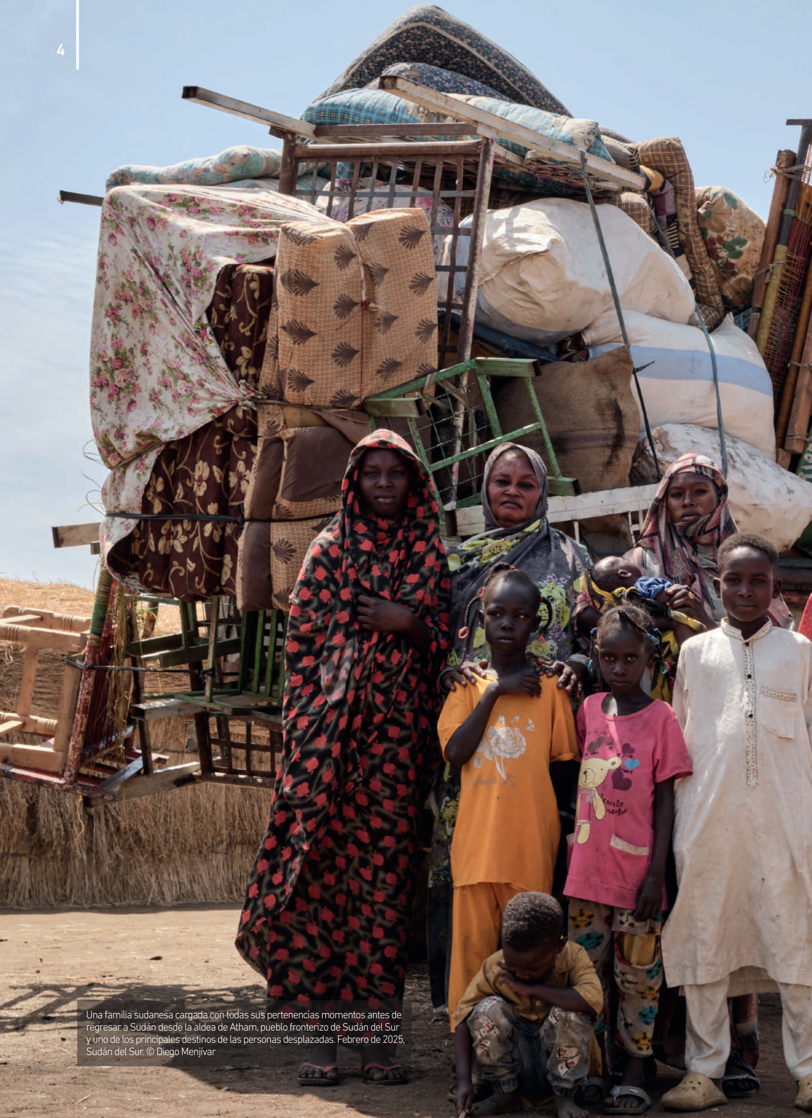
Una familia sudanesa cargada con todas sus pertenencias momentos antes de regresar a Sudán desde la aldea de Atham, pueblo fronterizo de Sudán del Sur y uno de los principales destinos de las personas desplazadas. Febrero de 2025, Sudán del Sur.