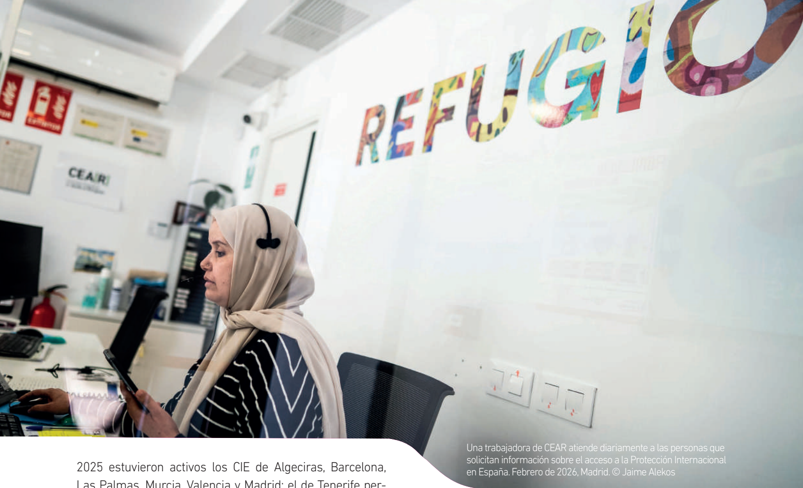
Una trabajadora de CEAR atiende diariamente a las personas que solicitan información sobre el acceso a la Protección Internacional en España. Febrero de 2026, Madrid.

2025 estuvieron activos los CIE de Algeciras, Barcelona, Las Palmas, Murcia, Valencia y Madrid; el de Tenerife permaneció inactivo por cuarto año consecutivo. El nuevo CIE de Algeciras-Botafuegos, con 500 plazas, entró en funcionamiento en fase de pruebas en noviembre de 2025. Este macrocentro es el mayor de España, y su creación y puesta en marcha acentúa la visión criminalizadora hacia las migraciones, tal como denuncia la Coordinadora contra los CIE y las organizaciones miembros de la red Migregroup en España, entre las que se encuentra CEAR, que rechazan la apertura de nuevos centros.