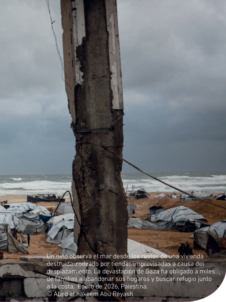
Un niño observa el mar desde los restos de una vivienda destruida, rodeado por tiendas improvisadas a causa del desplazamiento. La devastación de Gaza ha obligado a miles de familias a abandonar sus hogares y buscar refugio junto a la costa. Enero de 2026, Palestina.