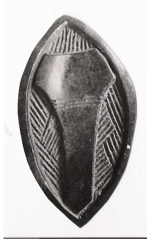
D'AUTRES PIÈCES DU JEU D'ABIA VUES A NSOLA CHEZ LES EVUZOK