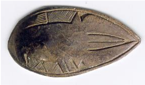
MRAC.-Turveren.: EO 1980.2.460