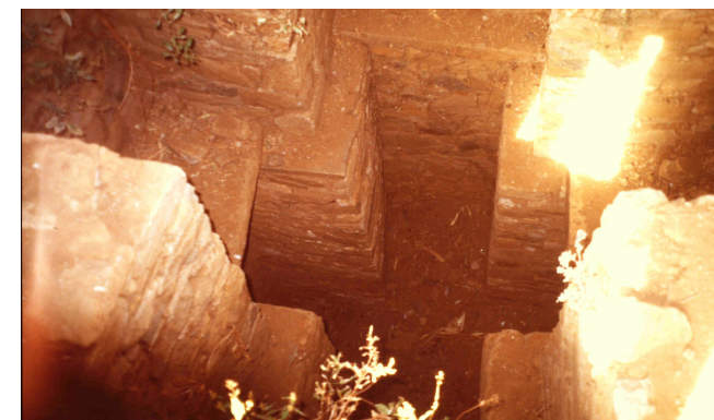
Cripta funeraria Ortodoxa Copta