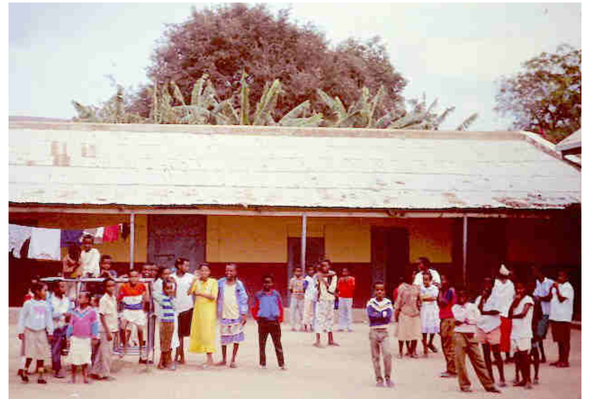
El antiguo centro de acogida