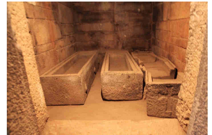
Bajada a la cripta y tumba donde se supone fueron enterrados el rey y la reina