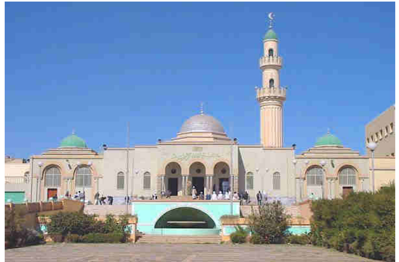
Gran Mezquita de Asmara