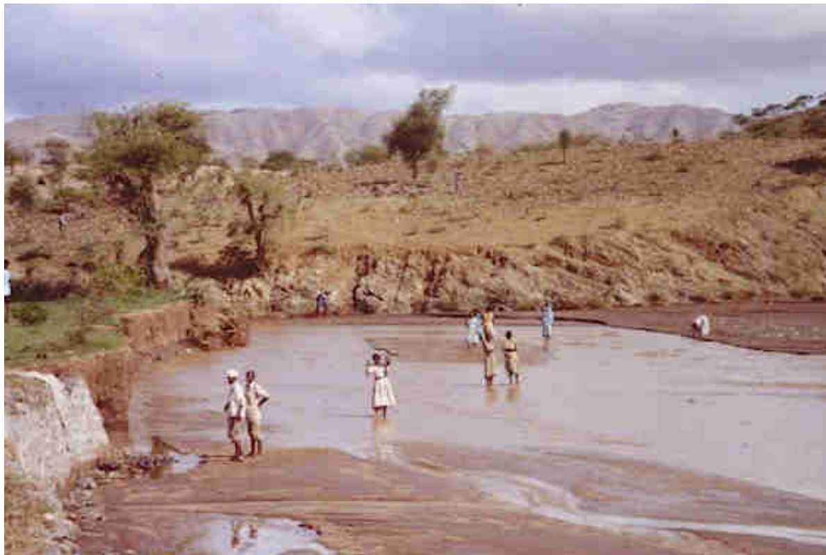
Antes del proyecto, recogida de agua para regar