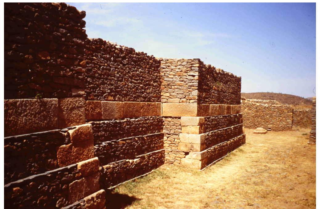
Restos del Palacio de Menelik I (hijo de la Reina de Saba y Salomón) siglo X a. C.