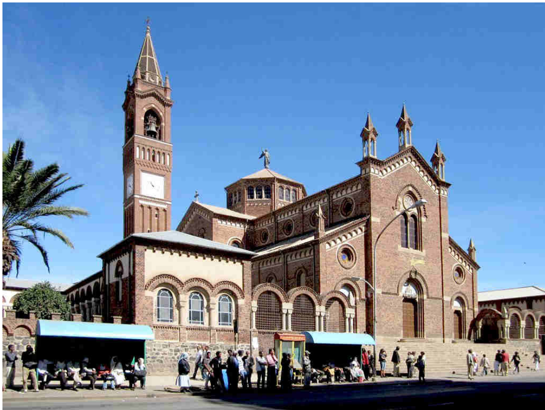
Catedral San José de Asmara

Eritrea tiene dos religiones predominantes: el cristianismo, con el 62% de seguidores y el Islam, que agrupa el 36,2% de la población. Los cristianos pertenecen principalmente a la Iglesia Ortodoxa Eritrea, que es un patriarcado de la Iglesia Copta y representa el 57,7% de la población. También hay una cantidad considerable de católicos que pertenecen a la Iglesia Católica Eritrea, un catolicismo de tipo oriental que representa el 4,6% de la población.