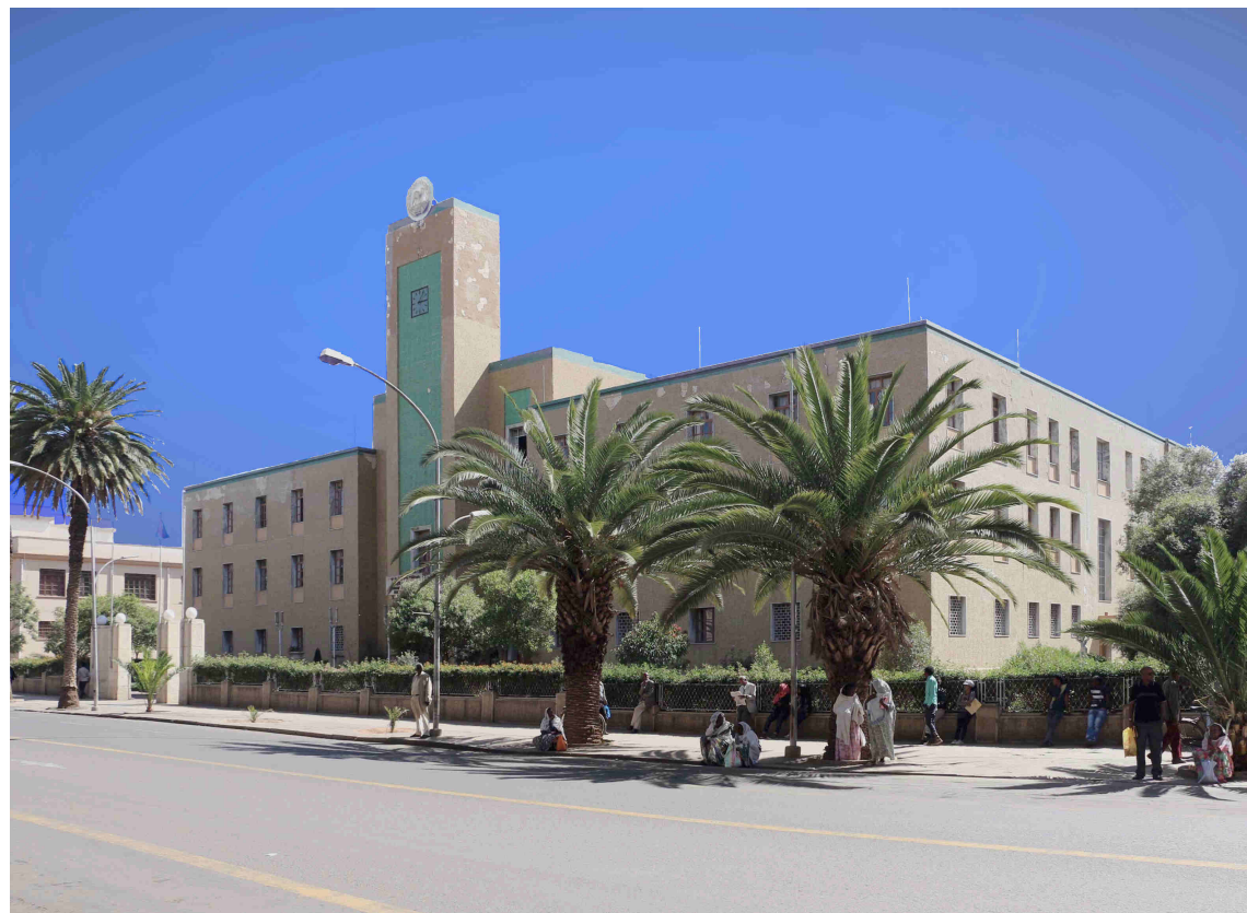
Sede del gobierno de Eritrea

Hacia 1940 había cerca de 100.000 colonos italianos, lo cual tuvo repercusiones en la arquitectura de algunas de sus ciudades y en la religión de sus habitantes.