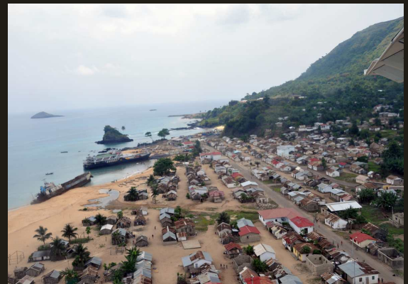
Palé (capital de Annobón).

Entre los annoboneses y los criollos fernandinos algunos instrumentos y danzas han experimentado “África de ida y vuelta” o retorno de lo africano tras la abolición de la esclavitud: el cumbé, tambor cuadrado con patas que en Jamaica se denomina gumbé y kunkí entre los fernandinos, así como el rito del bönkó o ñánkue llegado desde Cuba...” (Notas extraídas del libro Instrumentos musicales de las etnias de Guinea Ecuatorial de Isabela de Aranzadi, Madrid, Editorial Apadena, 2009).