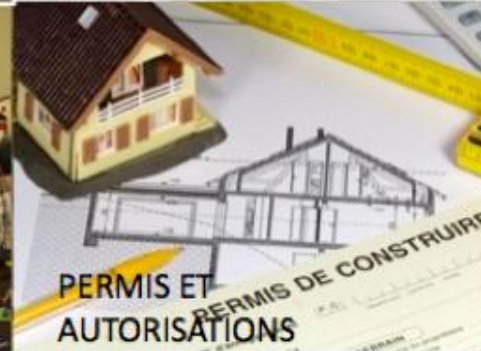
PERMIS ET AUTORISATIONS