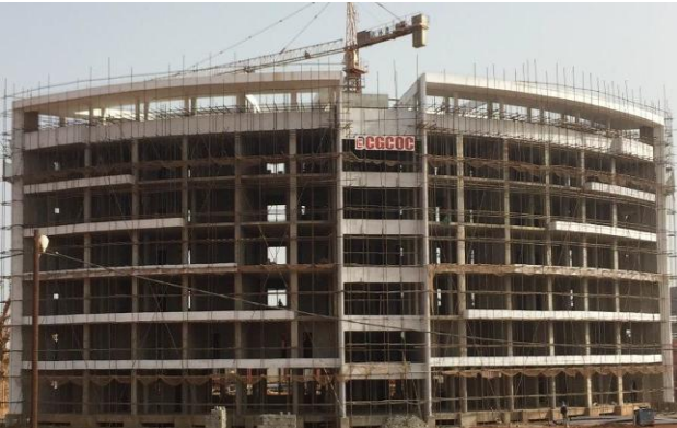
— Bureaux —→