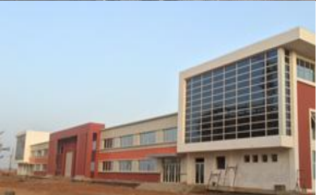
— Hangar Type B 2 700 m 2 —→