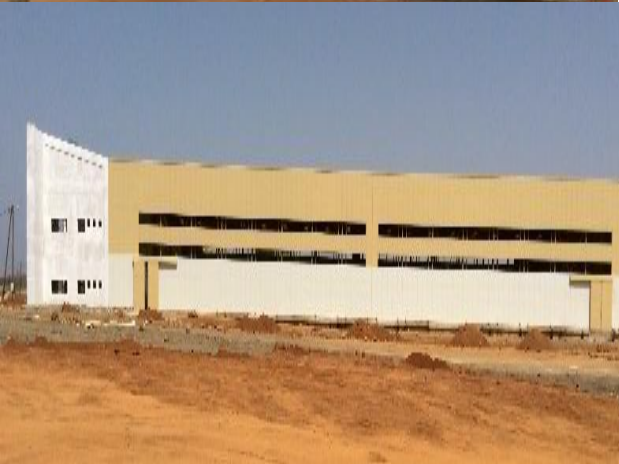
— Hangar Type A 7 200 m 2 —→