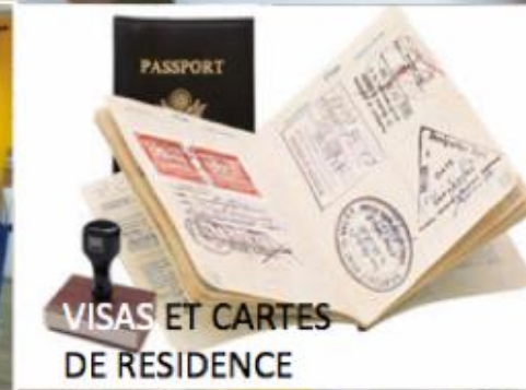
VISAS ET CARTES DE RESIDENCE