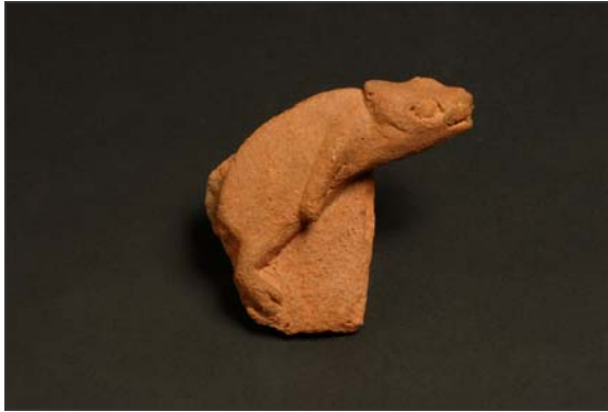
Camaleón Opa, Ife Siglos XII-XV d.C. Terracota Comisión Nacional de Museos y Monumentos, Nigeria

Se han encontrado esculturas en piedra por toda la ciudad de Ife y sus alrededores, y su amplia variedad de estilos sugiere que se moldearon a lo largo de un dilatado período de tiempo. Por hallarse en contextos religiosos, se consideran esculturas sagradas, ya representen éstas a animales, a personas deificadas, o se trate de monolitos minimalistas descritos como bastones de poder, escudos o espadas.