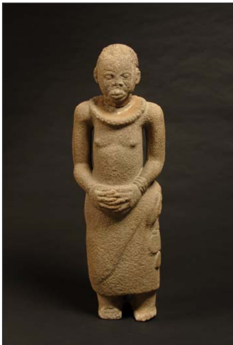
Figura de Idena Arboleda de Ore, Ife Siglos XII-XV d.C. Gnéis biótico y clavos de hierro Comisión Nacional de Monumentos...

Conocida como Idena, "guardián de la puerta", se dice que esta figura vigilaba las carreteras que llevaban a la sagrada Arboleda de Ore, donde se realizaban actos rituales de veneración.