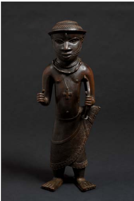
Figura de mensajero

El legendario gobernante de Ife en el siglo XIV, Obalufón II, continúa siendo un personaje importante en la vida ritual y política, no sólo en la ciudad de Ife, sino también fuera de ella.