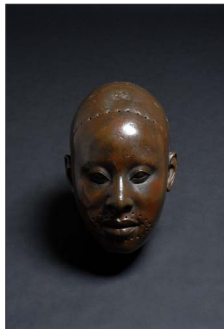
Máscara llamada "Obalufón"

Se incluyen también exquisitas miniaturas, deliciosas representaciones de animales domésticos y salvajes en terracota y piedra, un ejemplar de los monumentales menhires de granito, expresivas caricaturas de ancianos, representaciones de enfermedades atroces, monstruosas figuras imaginarias y vívidas figuras de animales. Destaca el grupo de impresionantes cabezas de tamaño natural en cobre y diversas aleaciones y la máscara de cobre de Obalufón.