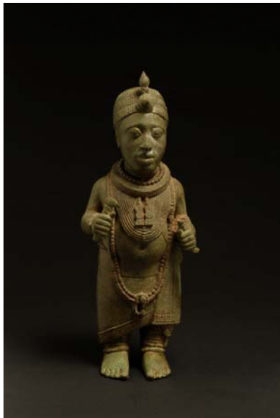
Figura de un rey

La antigua Ife la formaban un grupo de poblaciones asentadas en un fértil valle agrícola, sus gentes diseñaron pavimentos cerámicos con distintos motivos, moldearon sorprendentes obras en metal fundido y crearon objetos rituales en terracota, todos ellos de extraordinaria calidad. Hacia el año 1100 d.C., los artistas de Ife ya habían desarrollado una refinada y sumamente naturalista tradición escultórica en terracota y piedra, que pronto se vio acompañada de otras obras en aleación de cobre. Esculturas de tan exquisita belleza, que Ife se aseguró un lugar en la historia del arte africano y universal.