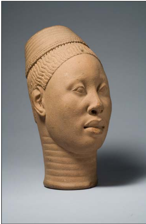
Cabeza denominada "Lajuwa"

Los artistas de Ife crearon esculturas y vasijas de terracota en las que representaban diversas figuras humanas y animales y diferentes seres divinos. Las cabezas independientes retratan a los más altos cargos reales o a servidores de la corte, mientras que las representaciones de los plebeyos constituyen una expresión del carácter cosmopolita de la población de Ife.