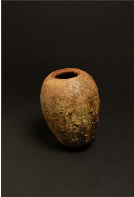
Crisol para el trabajo del cristal

Las relaciones comerciales de la ciudad de Ife se extendían hacia el norte a través del Sáhara, y hacia el sur hasta la costa del océano Atlántico, siendo una de las rutas comerciales más importantes la desarrollada a lo largo del río Níger.