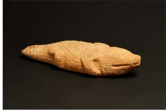
Cocodrilo Arboleda de Ore, Ife Siglos XII-XV d.C. Gneis Comisión Nacional de Museos y Monumentos, Nigeria