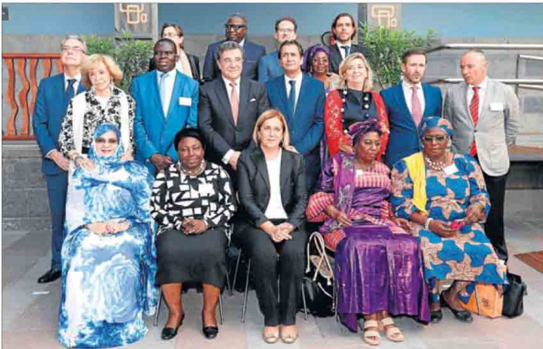
Foto de familia. Imagen de las figuras que ayer participaron en la firma de la Declaración Política sobre las Mujeres en el Sahel, en Casa África.