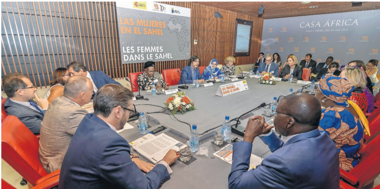
Reunión internacional sobre las mujeres en el Sahel, ayer en Casa África.