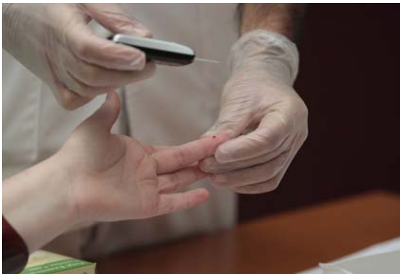
Cerca del 75% de las personas con diabetes derivadas por médicos de familia tiene obesidad o sobrepeso.

Además, el proyecto incluirá información sobre cómo evitar la diabetes a través de una vida saludable con una dieta sana, variada y con ejercicio físico.