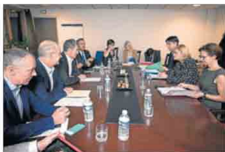
Reunión. La delegación canaria con Corina Cretu.