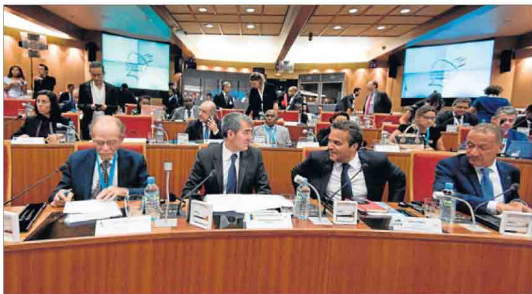
Compromisos. Fernando Clavijo (c) en la reunión de los presidentes de las RUP celebrado en la Guayana Francesa.