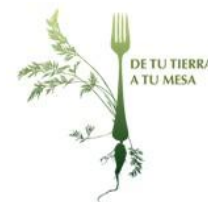
Cooperativa Cosecha Directa