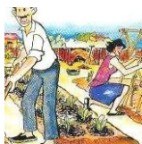
ADESCO Asociación para el desarrollo de la Economía Social y Comunitaria