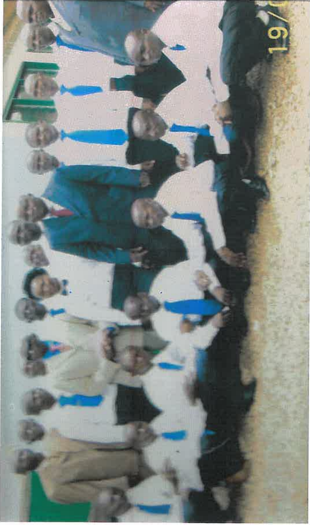
Equipe de topographe-urbanistes formés par l'ONG