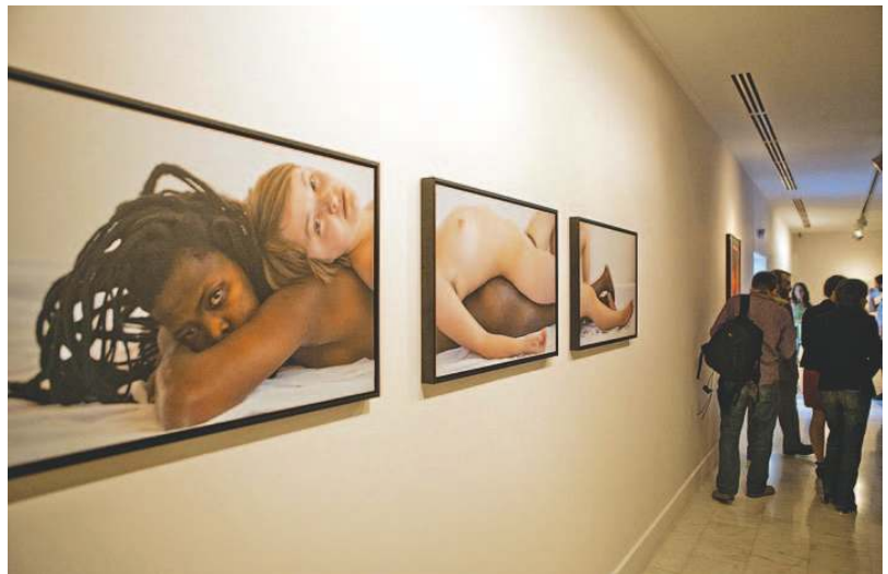
Imagen de una de las obras de la exposición en la que Zanele Muholi es protagonista.

Autorretratos. La fotógrafa es también protagonista de su propia obra en una serie de autorretratos que se pueden ver en Casa África. Ocupar el espacio público es una de sus prioridades artísticas.