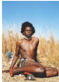
La artista y 'Miss D'vine', la obra premiada. | J.C. GUERRA