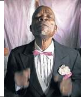
HÉCTOR MEDIAVILLA / BAUDOIN MOUANDA

Los fotógrafos Héctor Mediavilla y Baudouin Mouanda exponen en Casa África 80 imágenes en las que retratan a los miembros de la asombrosa Sociedad de Ambientadores y Personas Elegantes (SAPE), una asociación que siembra la elegancia en los barrios pobres de Brazzaville y Kinshasa