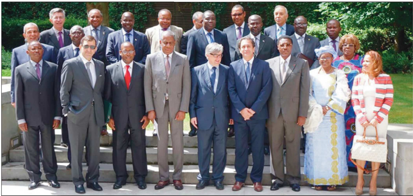
Encuentro. Reunión del Consejo Diplomático de Casa África, con la presencia de los Embajadores africanos en España. Hoy, dieciséis de ellos acuden a la reunión con el Ministerio y las autoridades comunitarias.