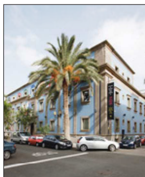
Instalaciones. La sede de Casa África, en Las Palmas de Gran Canaria.