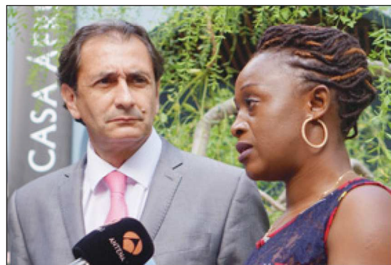
Caddy Adzuba, premio Príncipe de Asturias de la Concordia, en Casa África.

Durante el año 2015 también, la sala de exposiciones de Casa África ha albergado varias muestras. La más reciente y que todavía está abierta al público es la que reúne un conjunto de fotografías sin firma que retratan Madagascar a principios del siglo XX. Bajo el nombre de Madagascar 1906, el visitante puede adentrarse en el mundo malgache de principios de siglo pasado para poder entender