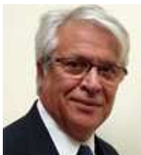
Joan Clos, Director Ejecutivo del Programa de las Naciones Unidas para los Asentamientos Humanos (ONU-Hábitat)

El 25 de agosto de 2010, la Asamblea General eligió al Sr. Joan Clos de España como Director Ejecutivo del Programa de las Naciones Unidas para los Asentamientos Humanos (ONU-Hábitat), por un período de cuatro años, a partir del 18 de octubre de 2010. El Programa ONU-Hábitat, establecido en 1978 para promover pueblos y ciudades social y ambientalmente sostenibles con el objetivo de proporcionar una vivienda adecuada para todos, contribuye igualmente con el objetivo general de la Organización de las Naciones Unidas de reducir la pobreza. El Sr. Clos ha sido recomendado para el cargo por el Secretario General de las Naciones Unidas, Ban Ki-moon.