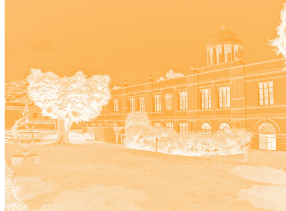
Sede Institucional ULPGC C/ Juan de Quesada, 30 Las Palmas de Gran Canaria